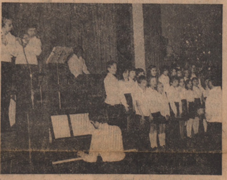
Otroški zbor in del orkestra