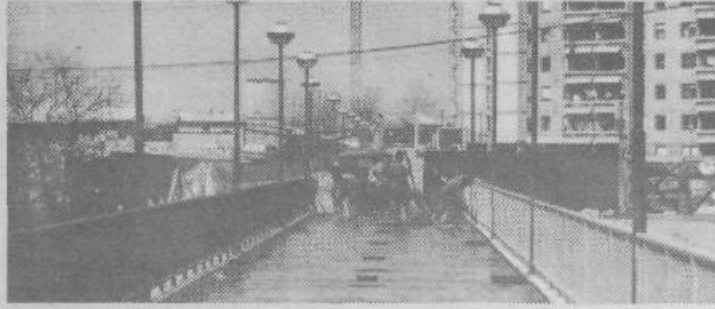
Brv številka 2 v Fužinah, 8. aprila je bila pripravljena za asfaltiranje, do 1. maja pa bo tudi uradno odprta.