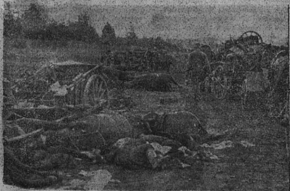
Topništvo je naredilo polno delo.

Pri tem je sestrelilo 980 letal sovjetske zračne sile ali pa jih bilo na tleh uničenih. (Nadaljevanje na 2. strani.)