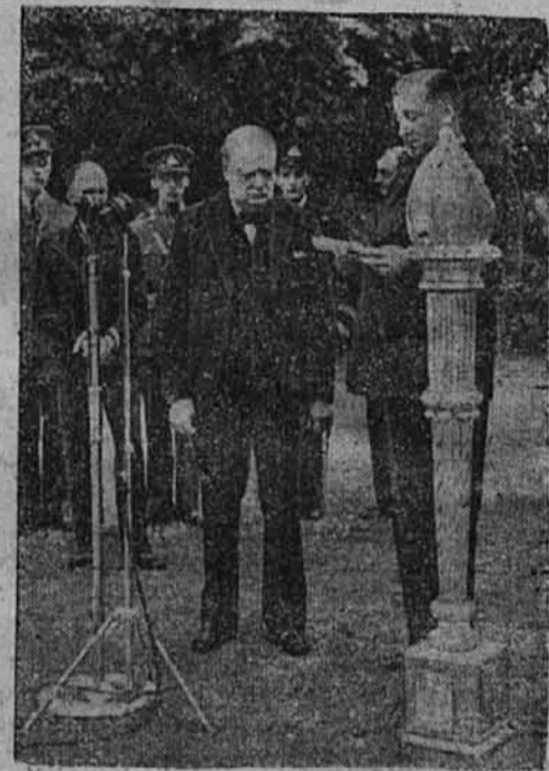
Kanadski ministrski penzionist preda Churchillju »bakljo zmage«.

○ Ankara. Kakor poročajo z pooblaščenega mesta, se bodo napovedana pogajanja za sklenitev nove nemško-turške