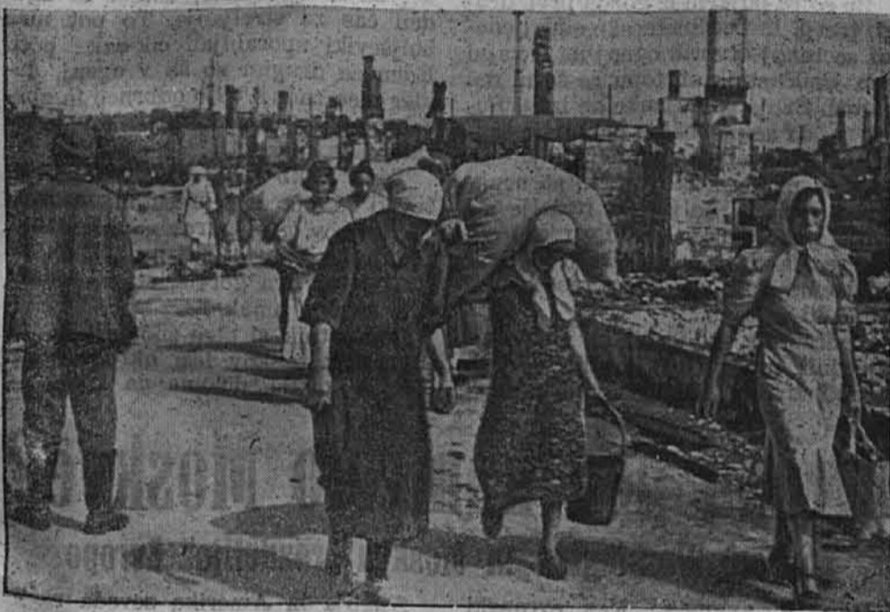
Stalin je dal povelje...

On sam, diktator obljubljenega sovjetskega paradiza, je pustil požgati industrijsko mesto Witelesk. Kaj ga briga, da sedaj tisoči begajo okrog brez hrane in strehe.