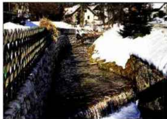
Belica še šumi skozi Bašelj, kar bi domačini radi ohranili za prihodnost.

"Vodovodni sistem Kranj oskrbuje s pitno vodo približno 59.000 prebivalcev, ki imajo več kot 10.900 vodovodnih priključkov. Poleg mesta Kranj dobivajo iz njega vodo naselja od Tupalič do Zbilj, Žabnice in Naklega. Iz vodovoda pod Kravcem se delno napajajo tudi raseja v občini Šenčur. V ves sistem priteče 4,5 do 5 milijonov kubičnih metrov vode na leto. Vode iz izvirov je približno 55 odstotkov, ostalo vodo pa dobimo iz črpališč. Glavne zaloge so v izviri Bašelj, Čemšenik, Nova vas, Krvavec in Olševek ter črpališču Gorenja Sava v Kranju, manjši vodni viri pa so Fovlje, Besnica, Javornik in Plarica. Zajetje Bašelj daje od 120 do 140 litrov vode na sekundo, zajetje Čemšenik od 15 do 20 litrov, zajetje Nova vas, ki ga upravlja Vodovodna zadruga Preddvor, pa 70 litrov. Vsi viri pod Kravcem dajejo 100 litrov vode na sekundo, črpališče Gorenja Sava pa jo lahko načrpa še enkrat toliko. Zaradi starosti zajetij so ponekod potrebne obnove. Na zajetju Bašelj se pojavlja ob večjem deževju kaljenje vode, zato je državna zdravstvena inspekcija izdala odločbo za odpravo težav. Z gradbe-