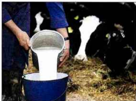
Na Gorenjskem, kjer je prireja mleka dobro razvita, že trgujejo z mlečnimi kvotami.

Pri prenosu kvote brez zemlje je del kvote treba izdvojiti v nacionalno rezervo, pri tem pa je razlika, ali gre za prenos znotraj statistične regije ali med regijami. V okviru regije je pri prenosu znotraj nižinskega območja ali z območja z omejenimi možnostmi za kmetijsko dejavnost (OMD) v nižinsko območje treba nameniti v rezervo deset odstotkov kvote, pri prenosu znotraj območja OMD in iz nižine v OMD območje, z izjemo gorskih ob-