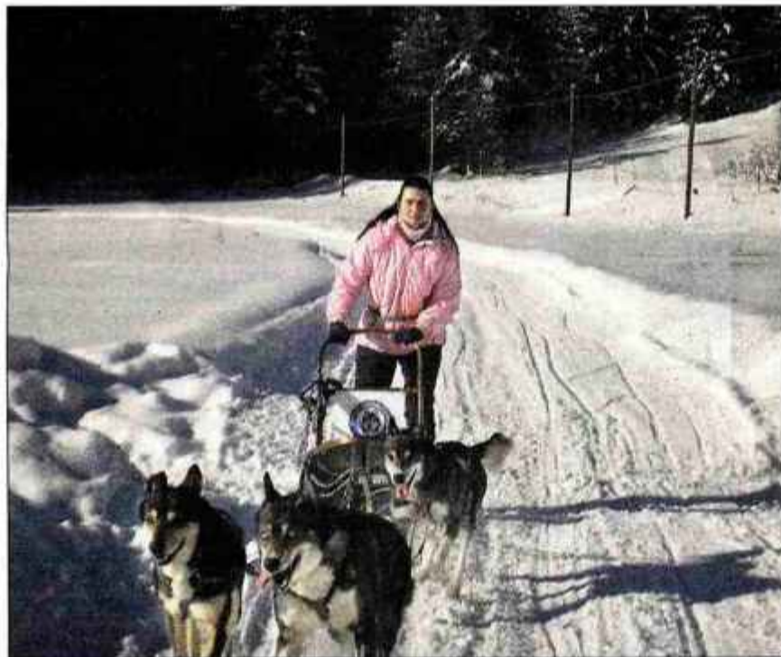
Za začetnike v sani vprežejo od dva do največ štiri pse pasme aljaški husky.