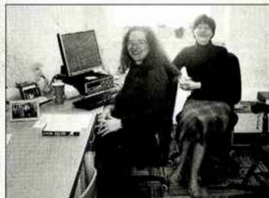
Stražni stolp, najbolj znano publikacijo Jehovovih prič, v Kamniku prevaja šestnajst oznanjevalcev.

Priče z veseljem pričakujejo, oznanjajo drugim, v centru na Duplici koordinirajo delovanje lokalnih verskih skupnosti po vsej Sloveniji. Skoraj dva tisoč jehovovih prič je registriranih pri nas, lansko leto je bilo krščenih nekaj več kot štirideset, vsako leto pa zabeležijo porast vernikov. V sodelovanju s svetovnim sedežem v Brooklynu v Združenih državah Amerike pa v kamniškem središču na posebnem prevajalskem oddelku, kjer dela šestnajst oznanjevalcev - prevajalcev, lektorjev in korektorjev, nastajajo tudi vse verske publikacije Jehovovih prič, med katerimi je gotovo najbolj znana revija Stražni stolp. Prispevki so prevedeni v več kot dvesto jezikov, saj je po svetu danes registriranih že več kot 6 milijonov. Priče, na Gorenjskem pa so dobro organizirani še v Kranju, v Radovljici in na Jesenicah. Pripadnike Jehovovih prič so okoliški stanovalci lepo sprejeli, da pa bi jih bolje spoznala še širša slovenska javnost, bodo v prihodnjih mesecih pripravili dan odprtih vrat.