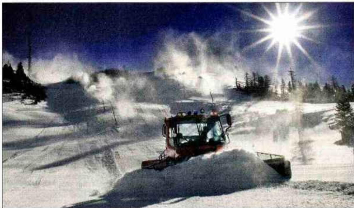
Krvavško smučiče se je ta teden utapljalo v soncu, o njegovi lasti pa se krešejo iskre.