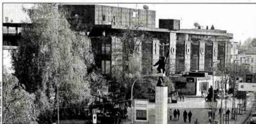
Ponudba za knjižnico v Globusu (na sliki) ni bila primerna.

Tudi v vsebinskem smislu ponudba ni sledila zahtevam naročnika, zaradi česar se samo po sebi zastavlja vprašanje, zakaj je bil sploh izbran. Izbrani ponudnik namreč ni navedel niti tega, kako bo zagotovil energetska varčnost objekta in možnost širitve prostorov, zahtevanih materialov pri talnih oblogah, stenah in stropih ni upošteval,