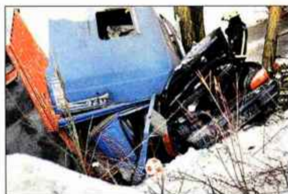
Tovornjak s 40 tonami železnih plošč so nekaj ur dvigali z zverženega avtomobila.

na nasprotni vozni pas. Pri tem je najprej oplazil osebni avto renault twingo, ki ga je vozila 33-letna voznica iz okolice Bleda, nato pa čelno trčil v tovorno vozilo, v katerem se je nasproti pripeljal 48-letni voznik iz okolice Kranja. Kia je ostala ukleščena pod sprednjim delom tovornega vozila, ki je zaradi deformacije karoserije zapeljal v levo, prebilo varovalno ograjo in zdrsnilo na dovorno pot pod glavno cesto. Jeseničanovo vozilo je ostalo ukleščeno pod tovornjakom, na katerem so bile naložene železne plošče. Kar nekaj ur je zato poteklo, preden so uspeli tovornjak in težak tvor dvigniti z avtomobila, v katerem sta takoj umrla voz-