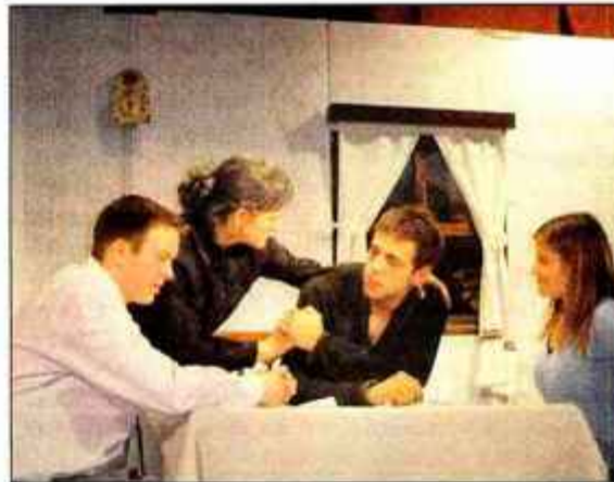
V predstavi ne manjka s čustvi nabitih prizorov.