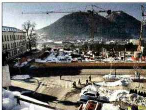
Bo na gradbišču ob Gimnaziji nova knjižnica?