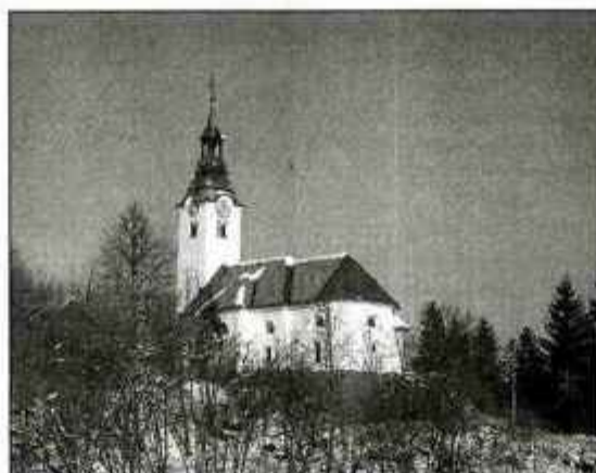
Cerkev sv. Ane na Ledinici.