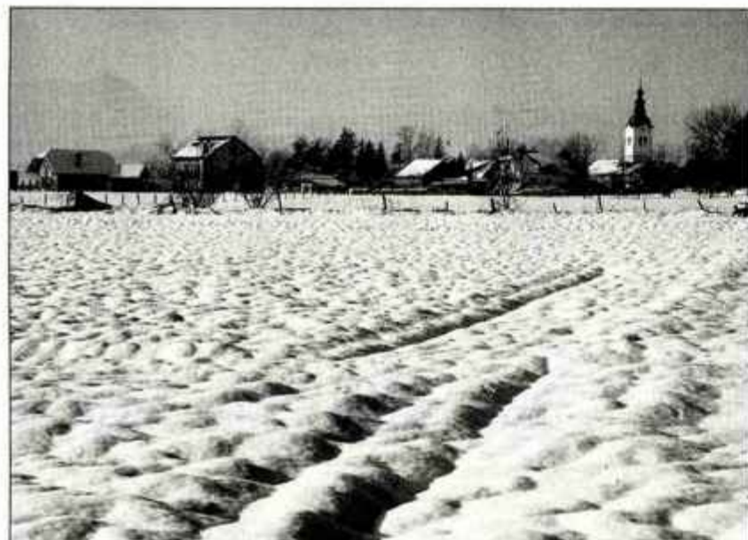
Na Jeprci naj bi na desetih hektarjih zrasla nova obrtna cona. Vprašanje pa je, kdaj?