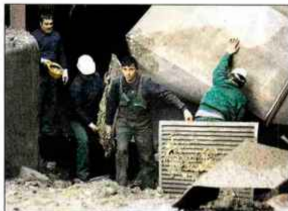
Eksplozija je odjeknila v proizvodnem obratu, kjer talijo surovine za proizvodnjo kamene volne.

Eksplozija je poškodovala tudi del proizvodne opreme, po nestrokovni oceni pa je povzročila za približno dva