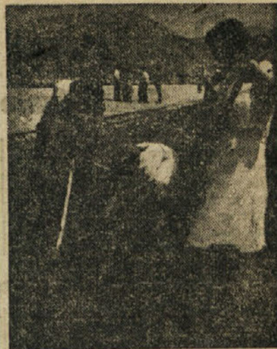
Tudi starejši ne zaostajajo. Kar z rokami premetavajo gruče težke zemlje

je tej slavnosti posvetila veliko skrb, saj so odkrivali spomenik tistim bor- cem in polagali vence tistim junakom, ki so nas začeli voditi po trnjevi poti, da smo danes prekaljeni v borbi spo- sobni resnično svobodni graditi socia- lizem.