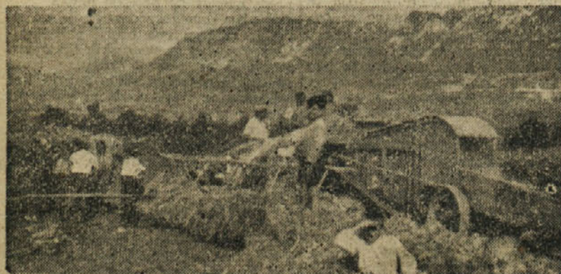
Povsod hitijo z mlačvijo, da bo odkup čimprej končan

Že v prvih dneh odkupa pa so se pojavili poedinci, večji kmetje, ki namerno zavirajo provilen potek odkupa in obenem svoje viške trdo držijo v svojih skladiščih z namenom, da bodo z njimi spekulirali in izkoriščali naše delovno ljudstvo. Prepričani smo lahko, da bo uredba o obvezni oddaji prekrizala te spekulantske namene in da bodo ti prej ali slej morali spreminiti svoje nezdravo mišljenje ter stopiti v borbo za izgradnjo socializma, ali pa odpasti, ker jih bo sicer naše delovno ljudstvo iz svoje srede izločilo.