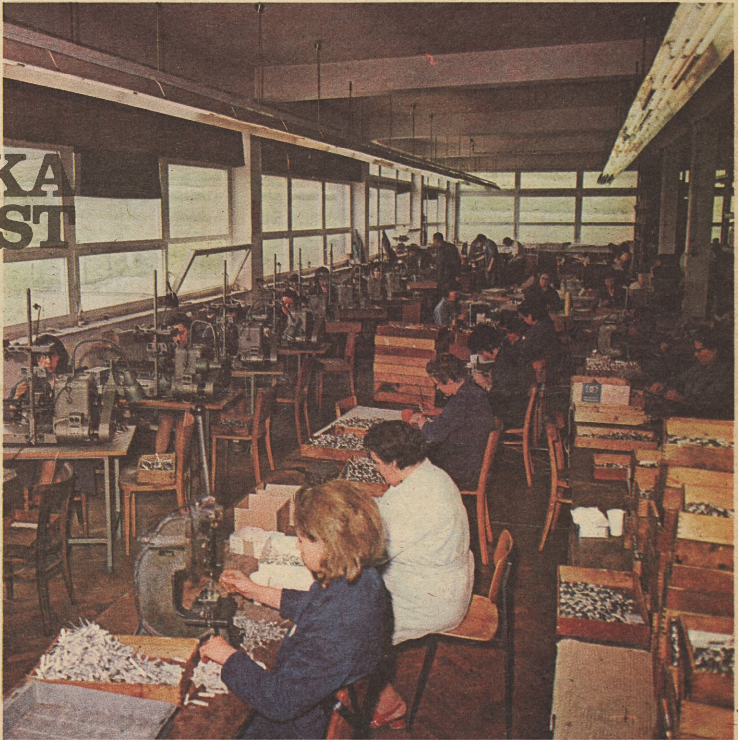
Tovarna Iskre v Horjulu je največja delovna organizacija v kraju - njen utrip v marsičem določa tudi utrip življenja v horjulski krajevni skupnosti. Več o tem na 12. strani.

Glede ustanavljanja samoupravnih interesnih skupnosti za posamezna področja gospodarstva in drugih dejavnosti pa so predsedniki občinskih svetov ZSS opozorili na več dilem v zvezi s praktičnim izvajanjem načel o doslednem uveljavljanju delegatskih razmerij in na dileme glede nosilcev organizacije, priprav in ustanavljanja teh skupnosti. Ker gre za vsebinsko in ne le za formalno izvajanje ustavnih obveznosti tudi na tem področju, so se udeleženci posveta dogovorili, naj ustrejni sektorji RS ZSS proučijo posamezna vprašanja, medtem ko naj bi se o ugotovljenih dilemah pogovorili in našli odgovor nanje na skupni seji predsedstev RK ZSS Slovenije in RS ZSS.