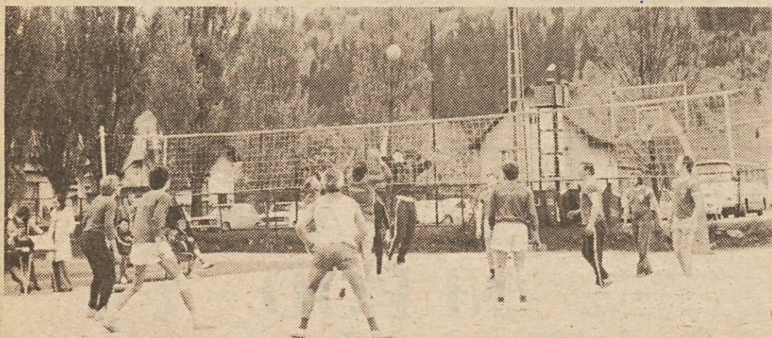
Tudi v odbojki so se najbolje odrezali jeseniški železarji ...