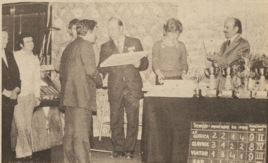
Najboljši so prejeli zaslužene lovorike v hotelu Ilirija

V streljanju je bil vrstni red najboljših malce drugačen. S 707 krogi so zmagali predstavniki Avtoprometa iz Nove Gorice, drugi so bili športniki ljubljanskega SAP (690), tretji koprškega Slavnika (prav tako 690 krogov) in četrty športniki