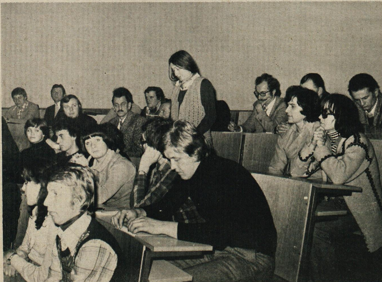
Javna tribuna o kulturni problematiki je postavila mnoge smernice za nadaljnje delo