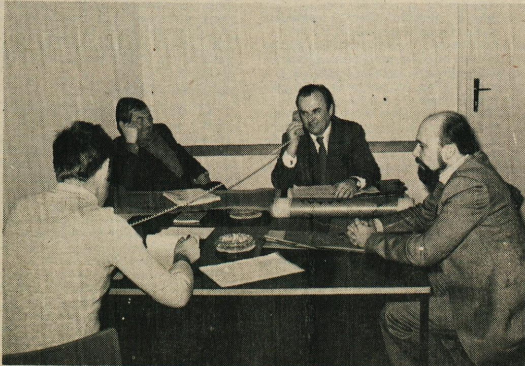
Skupina, ki je odgovarjala na vprašanja občanov je imela veliko dela