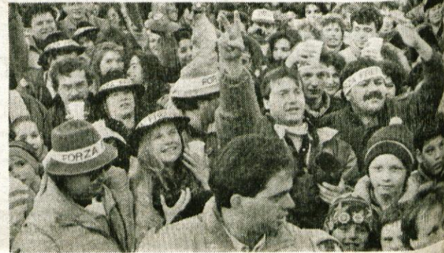
Franci, naš ponos, so klicali Petku v nedeljo v Lescah. Tudi na svetovnem prvenstvu ni bil osamljen. V Italiji so ga bodrili Ločani, seveda Leščani, s pokrivali in napisi: Forza, Frenk!