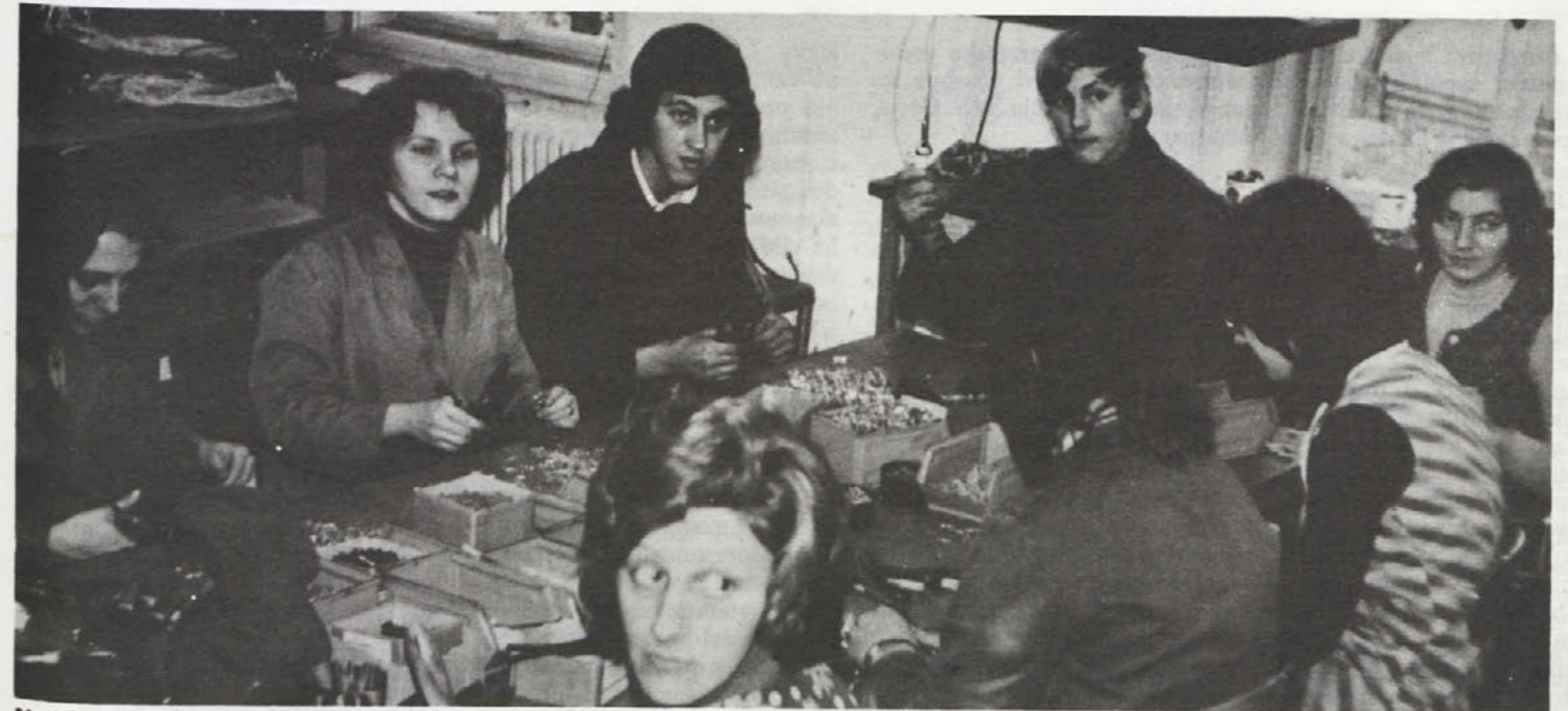
Na Mirni mesečno proizvedejo čez 2000 garnitur kabljskih snopov, ki potem potujejo v tovarne prikolice in v tovarno avtomobilov. Kabli morajo biti pravočasno narejeni, če hočemo, da linijska proizvodnja poteka brez zastojev.

Naj omenimo, da si v tovarni prizadevajo privarčevati denar, kjer le morejo. Letos bodo prihranili 200 ton goriva za kurjavo, kar predstavlja 50-odstotni prihranek, izražen v uglednih 20 milijonih. Ravno tako si na vso moč prizadevajo prihraniti čimveč materiala, kajti že 5-odstotni prihranek prinesejo tudi 20-odstotkov več dohodka. Zato pri njih posvečajo veliko pozornosti kontroli izdelkov in materiala. Vhodna kontrola dosledno odklanja vse, kar ne ustreza predpisani kvaliteti. Na začetku je bilo malo težko, zdaj, ko je to vpeljano, pa je lažje.