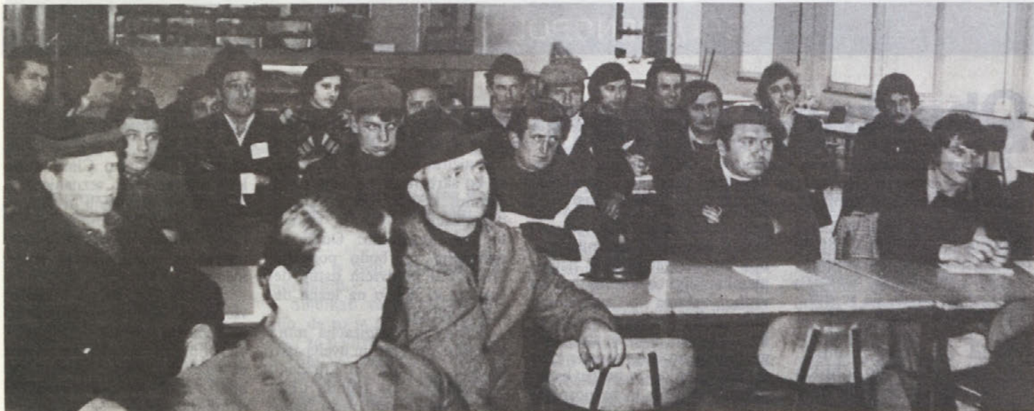
Tečaj za varstvo pri delu