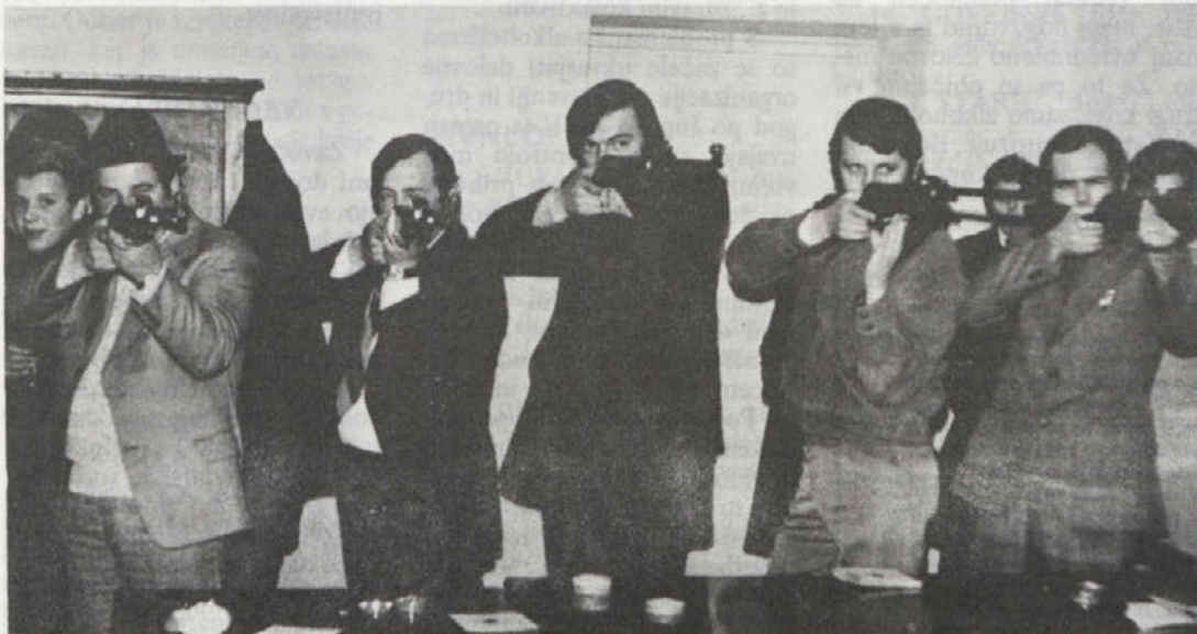
Strelska družina „Lojze Dragan“, ki jo sestavljajo člani IMV, je bila na delavskih športnih igrah med najuspešnejšimi, k temu pa je gotovo pripomogel tudi vsakodnevni trening, ki ga člani redno obiskujejo.