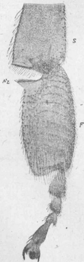
Del zadnje noge čebele (znotraj).

b) Krila. Čebele imajo po dva para kril. Sprednji večji par izraste iz stranske vezi med nahrbtno in trebušno polovico drugega oprskega obročka. Kr-