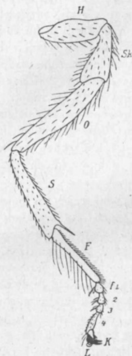
Sprednja noga čebele.

Čebela ometa s ščeticami sprednjih in srednjih nog tudi cvetni prah s prašnikov ter ga kopiči na zadnjih nogah (zato obnožina). Golen zadnjih nog je namreč na zunanji strani globeličasta. Plitvo globelico pa pregrinjajo toge (trde) ščetinice ter tako ustvarjajo kosček. S pomočjo ostrega trna na spodnjem koncu goleni sprednjih nog osmuka čebela obnožino iz koskov v celice.