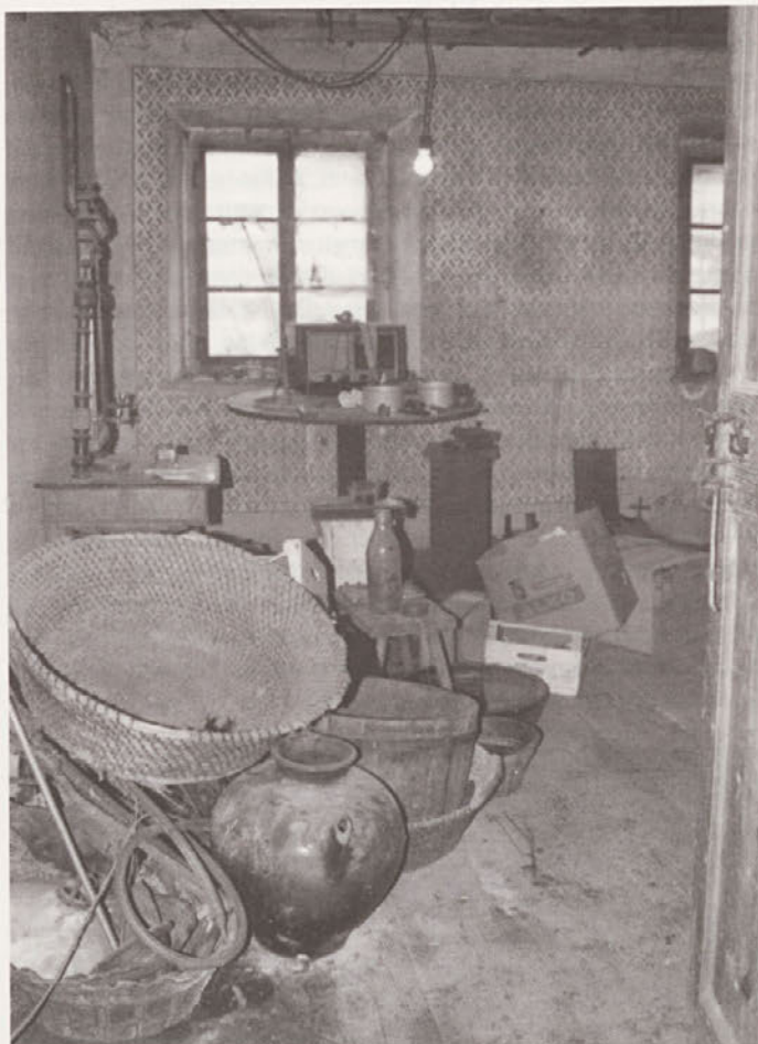
Podstrešna soba v Lesičnem 15, 5.10.1998