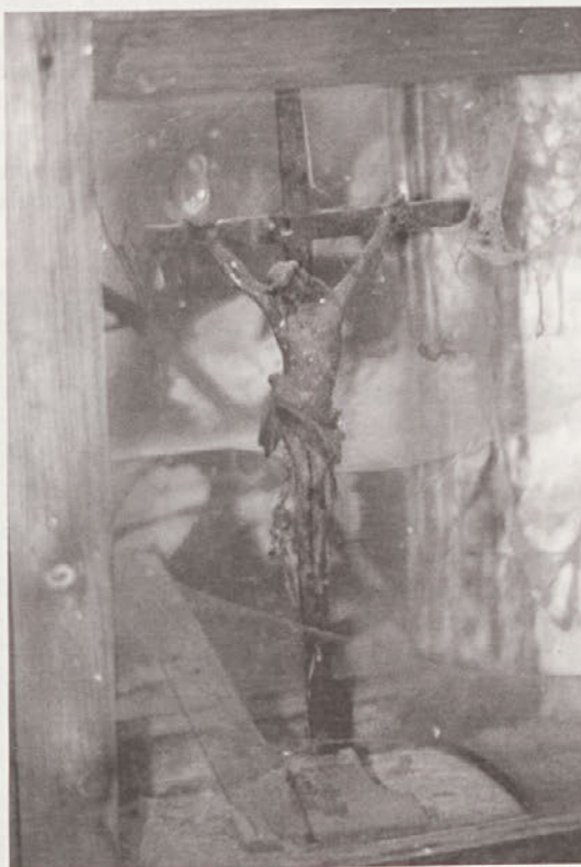
Razpelo

15 je kulturni spomenik. Stavba je v lasti Kozjanskega parka oz. Republike Slovenije. V hiši, ki je pomembna zaradi svoje lege nasproti podružnične cerkve sv. Urha, sta v kleti dve delavnici - kolarska in kovaška. Stavba je rariteta tudi zaradi svoje zasnove, saj sta na področju parka le še dve podobno zasnovani. V neposredni bližini obravnavane domačije se nahaja že omenjena podružnična cerkev Sv. Urha, Mačkova hiša in pred njo stoječe kamnito stebarno znamenje "premišljujoči Kristus" (vulgo "hrvaški Kristus") iz leta 1713. Vsi štirje objekti so izjemni v svoji povednosti, zato je umestno razmišljanje o celovitem urejanju "trga", še zlasti ker se v njihovi neposredni bližini nahajajo po potresu zgrajeni stanovanjski objekti, ki starejše degradirajo.