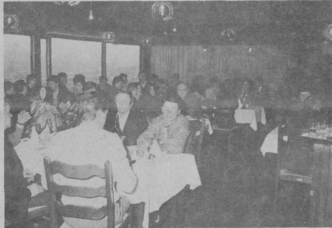
Delavci Splošnega mizarstva so ob dobrih doseženih rezultatih z zadovoljstvom praznovali