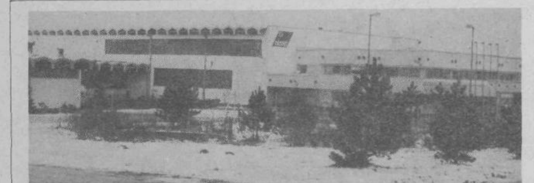
Delavci obrata UNIS—ELKOS v Grosupljem so v zadnjem času soočeni s težavami, ki so nastale zaradi visokih obresti na kreditna sredstva. Več o reševanju problemov bomo objavili v januarski številki