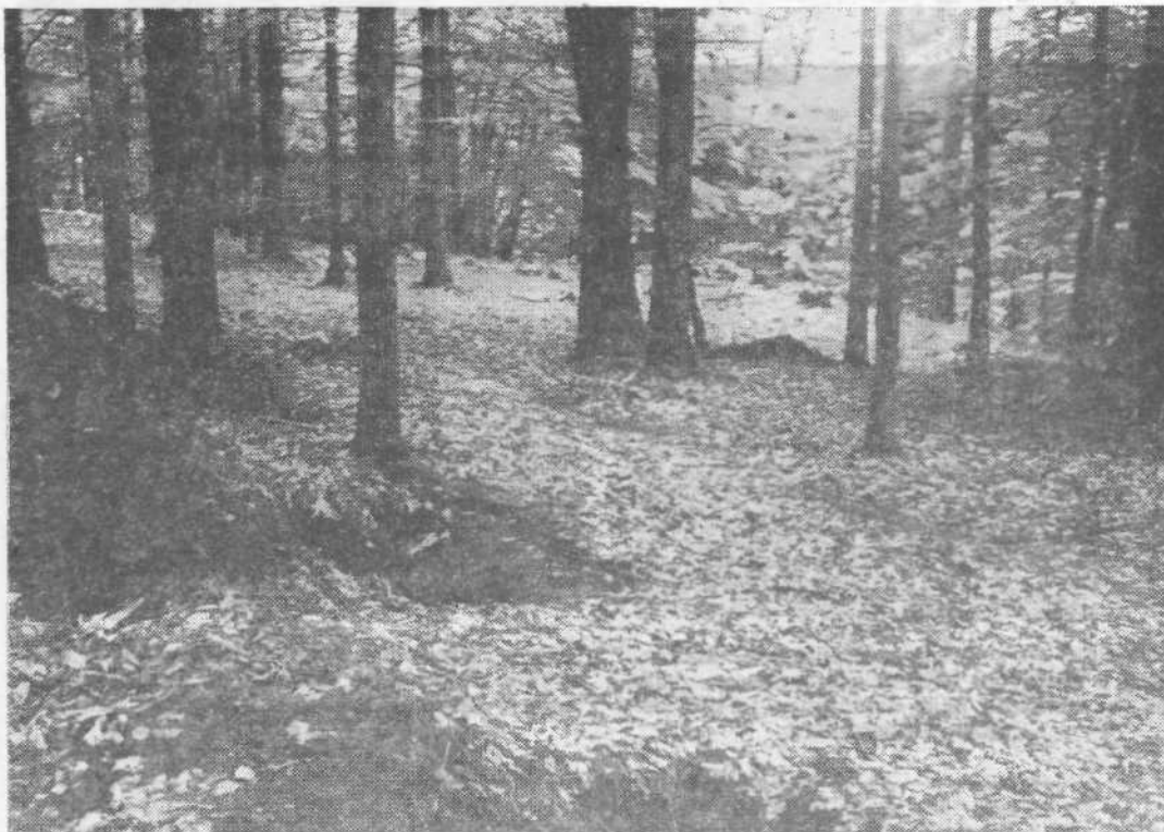
Narava je lepa — in radi jo imamo. Toda, ali res storimo vse, da bi takšna tudi ostala...?