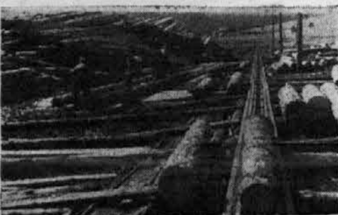
Na žagi Marof pod Snežnikom

Vsak dan prinašajo časopisi poročila s te mogočne fronte dela, ki je vsepovsod, kjer so gozdovi: na Kočevskem Rogu, na Pohorju, na Pokljuki. V Ljudski republiki Sloveniji je delalo do sedaj okrog 200 brigad, to je preko 18.000 prostovoljnih delavcev. Odkod so se vzeli vsi ti ljudje? Ljudska fronta je mogočna, enotna in trdna organizacija; iz nje so izšle te množice delovnih ljudi. Ljudska fronta je dala razpoložljivo delovno silo, ki ni najnujnejše zaposlena na ostalih delovnih mestih. Delavec, kmet, obrtnik, intelektualec, vsi so se složno zbrali k delu — kot nekdanj k borbi. Vsi vedo: če bomo o pravem času pripravili les za izvoz, več potrebnih strojev bomo imeli, stroji pa pomenijo za nas traktorje, avtomobile, čevlje, obleko, skratka lepše in boljše življenje; partizani so imeli prav! Za člane Ljudske fronte je to preprost in enostaven račun kakor enkrat ena in ne