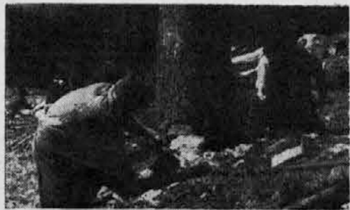
Gozdna FDB na delu

Vsaj delavno ljudstvo je spremljalo brigade pri njihovem delu, razne poklicne in diletantске umetniške skupine pa so se jim oddolžile na ta način,