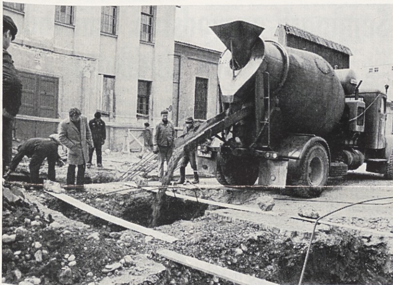
Zgradbo strojne dodelave KS II gradi SGP Obnova — Ljubljana. Na sliki: betoniranje temeljev