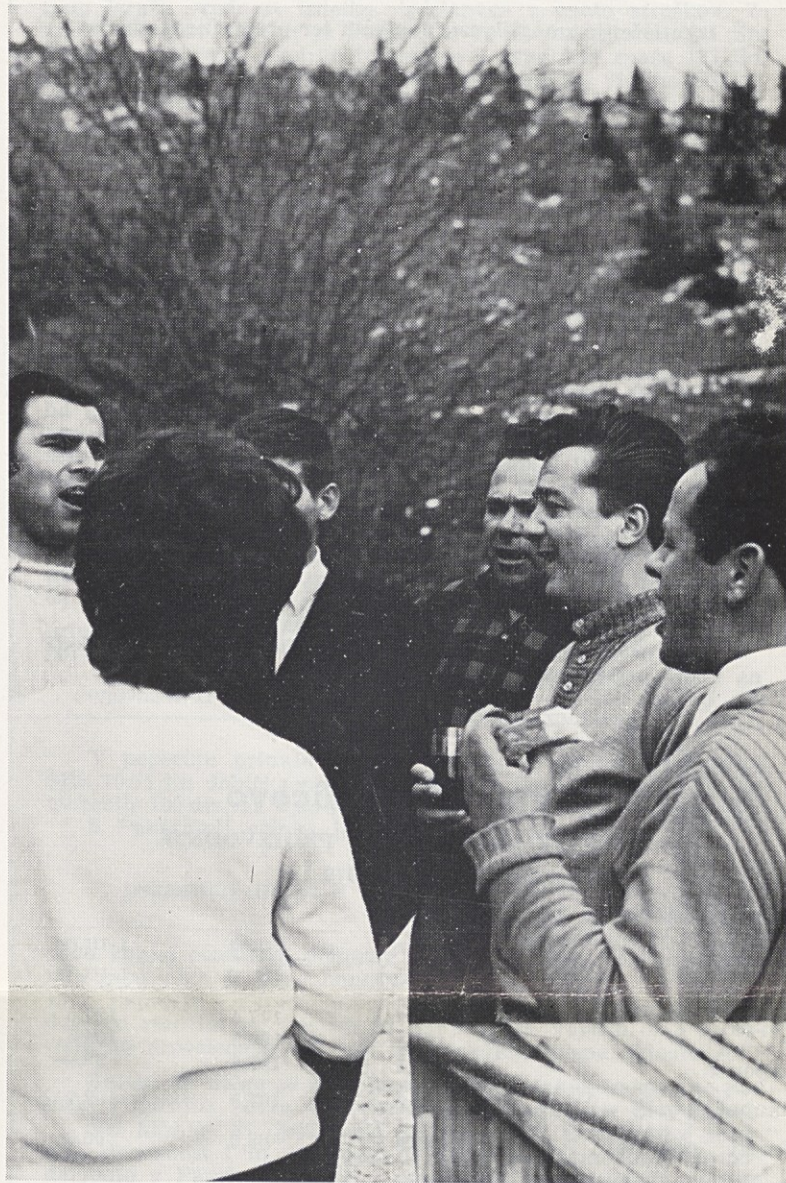
Tudi letos bo v naravi ob prvomajskih praznikih zadonela pesem. (Posnetek z majskega izleta ob koči na Veliki planini)