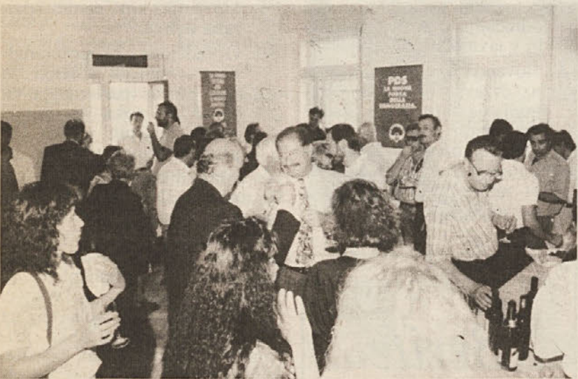
■ Tržaška federacija Demokratične stranke levice ima nov sedež v strogem središču mesta, v Ul. Spiridione 7. Nov sedež so uradno odprli prejšnji torek s sprejemom, ki se ga je udeležilo veliko članov in gostov. Deželno vodstvo stranke za zdaj ostaja na Ul. Capitolina.