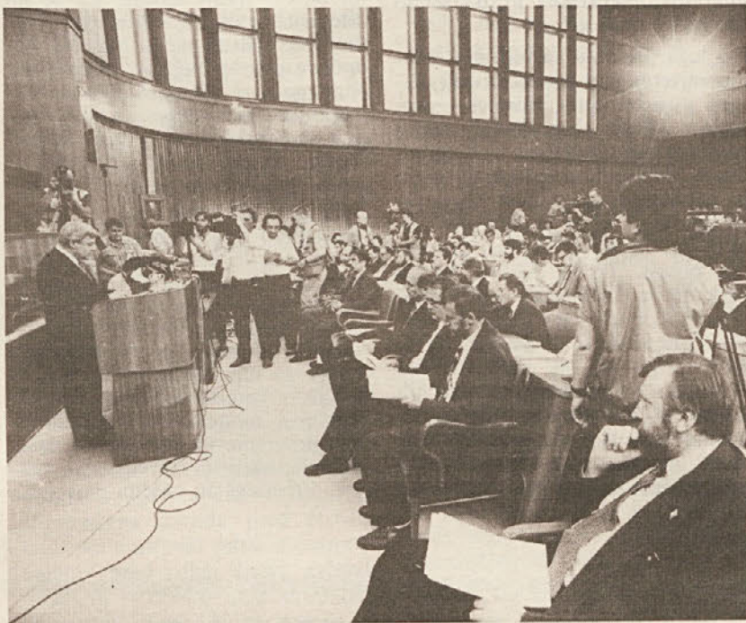
■ Slovensna seja slovenskega parlamenta, na kateri so proglasili neodvisnost in suverenost Republike Slovenije.

Taka razmišljanja in dejstva pa gotovo ne morejo zmanjšati pomena naše opredelitve za suvereno Slovenijo oziroma obsodbe zatiranja demokratičnih izbir velike večine zainteresiranega prebivalstva. Novo realnost v Sloveniji, dosedanji Jugoslaviji in Ev-