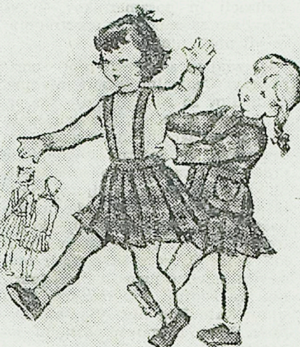
Dvodelná oblekica za našega otroka. Krilce ima gube, jopica pa je krojena ravno in je precej dolga.

krit in naraven, ki mu ni lagal in ga zavajal, ga bo lahko tudi zavrnil, če bo videl kako neprimerno in škodljivo težnjo, kajti otrok mu bo zaupal. Naš sodobni ideal je, da naj izve otrok naravno in postopoma o spolnem življenju vse, kar mora vedeti.