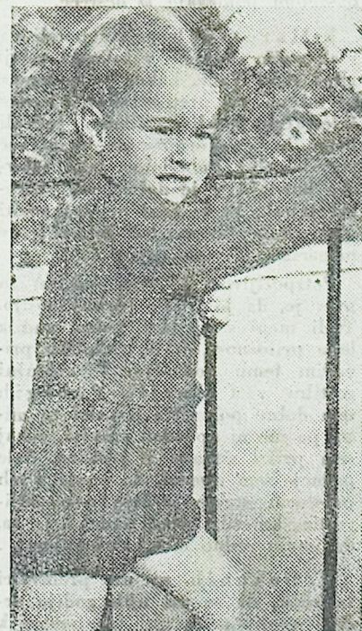
Pletena garnitura za naše dečke: lahko je eno- ali dvodelná, kakor se nam pač zdi bolj praktično.