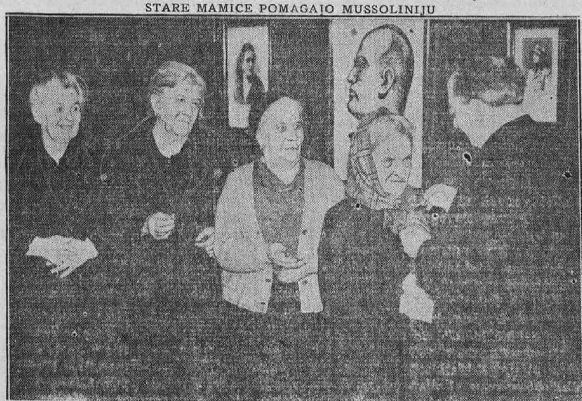
Italijansko ljudstvo po celem svetu se je odzvalo pozivu Mussolinija, naj odda svoje zlato državi, da bo mogla Italija finančno vzdržati v sedanji krizi. Tako vidimo na gornji sliki italijanske ženske v Londonu, ko so prinesle italijanskim oblastem svoje zlate spominke.