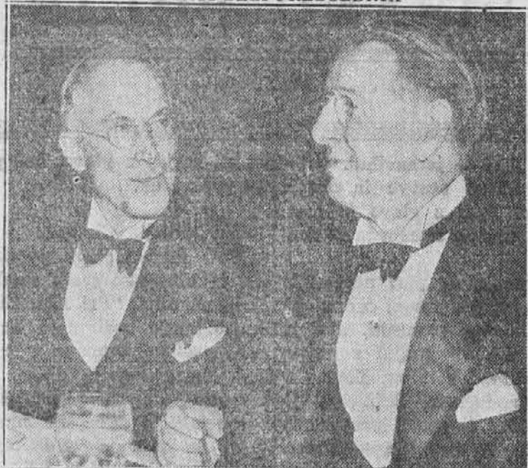
Na desni na sliki se vidi Frank Knox, izdajatelj nekega chicageškega lista, o katerem se trdi, da namerava prihodnje leto kandidirati za predsedniško nominacijo na republikanski listi.

naših ljudi zdravih in bolnih, pa četudi popolnoma odgovarjajo resnici. Zato strogo prepovedujejo vsakemu mobiliziranu, ki pride domov, da ne sme o razmerah in doživljajih ničesar povedati niti svojim najbližnjim. Na ta način skušajo tudi preprečiti, da ne pridejo posamezne vesti o resničnem stanju in o razmerah v katerih živijo naši vojaki v inozemstvo.