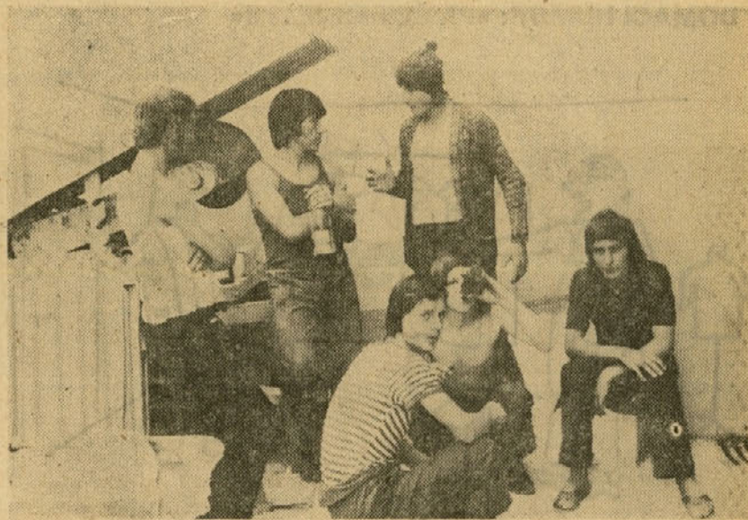
V teh vročih dneh se je skupini učencev — steklopihalcev prilegla senca ob požirku coca-cole.