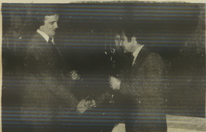
Direktor Zavoda za časopisno in radijsko dejavnost Murska Sobota podeljuje pokal predstavniku AMD Gorenje-Varstrov Lendava za osvojitve naslova najboljše športne ekipe Pomurja 1980.