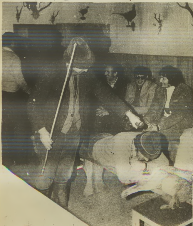
»Krstim te v imenu boginje Diane...«

Bograč je bil hudičevo začinjjen, zato ga pijača ni in ni mogla pogasiti. Se sreča, da so lendavske gorice letos dobro obrodile in je tako vina kar precej, pa ga zato tudi v lovske koči v Mali Polani ni zmanjkalo. Nekateri so se kar