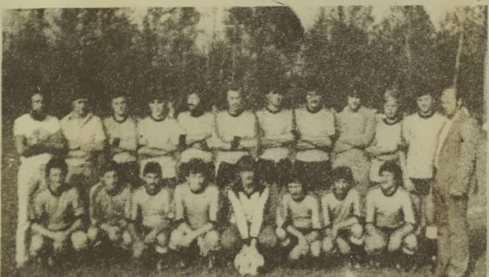
Nogometno moštvo Melinci, ki je osvojil pokal krajevnih skupnosti občine Murska Sobota. Po jesenskem delu tekmovanja v drugi medobčinski nogometni ligi Murska Sobota pa je na četrtem mestu.

Lesna industrija Platana TOZD LESNA PREDELAVA Murska Sobota Lendavska 25