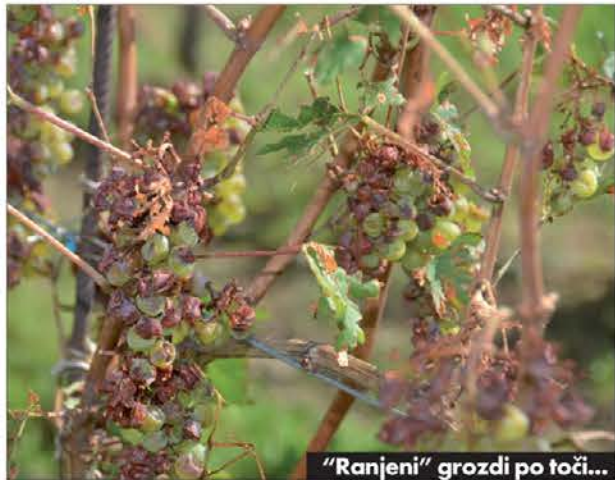
“Ranjeni” grozdi po toči...