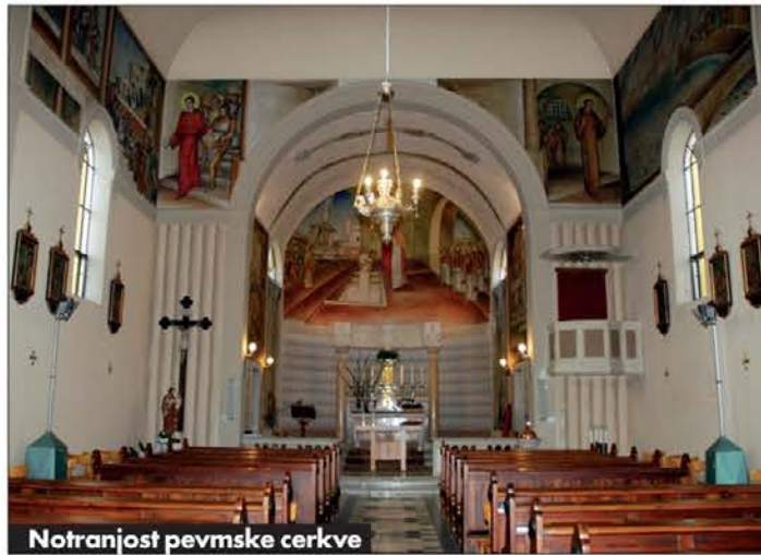
Notranost pevmske cerkve

trajajočo sprostitev v siju očarljive gledališke modrice. Isti dan so mladi in vsi tisti, ki jim je ta glasbena zvrst všeč, imeli rock marathon s poznanimi glasbenimi skupinami. V soboto pa je bil v Pevmi gost