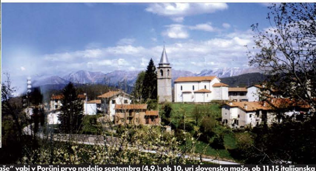
"Naš Lurd". Marija "po naše" vabi v Porčinju prvo nedeljo septembra (4.9.); ob 10. uri slovenska maša, ob 11.15 italijanska