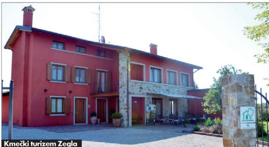
Kmečki turizem Zegla

vojne projekte, kot so vinogradi, hlevi, kmečki turizmi, foto-voltaične naprave itd. Denar se je izgubil po ovinkih birokracije.