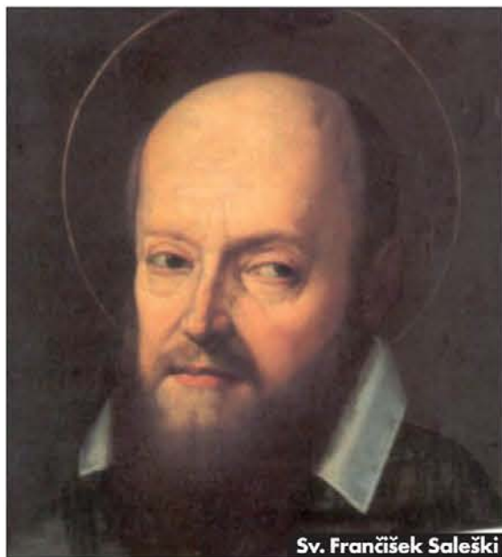
Sv. Frančišek Saleški

niki s pričevanjem najgloblji prepričanji prispevajo k temu, da splet ne bi postal le orodje, ki ljudi deli po kategorijah, jih skuša čustveno manipulirati ali omogoča tistim, ki imajo oblast, da monopolizirajo mnenja drugih. Nasprotno, verniki spodbujajo vse, naj ohranijo živa večna človekova vprašanja, ki potrjujejo njegovo željo po presežnem in domotožje po oblikah pristnega življenja, ki ga je vredno živeti. Ravno ta pristno človeška duhovna napetost, ki je skrita za našo željo po resnici in občestvu, nas sili k odkritemu in poštenemu komuniciranju. Zlasti mlade vabim, naj dobro uporabijo svojo prisotnost v digitalnem prostoru. Ponavljam svoje povabilo na prihodnji svetovni dan mladih v Madridu, ki se v pripravi močno naslanja na prednosti novih tehnologij. Boga prosim za medijske delavce, da bi bili na pripravo zavetnika sv. Frančiška Saleškega svoje delo vedno sposobni opravljati vestno in s poklicno natančnostjo, medtem ko vsem podeljujem svoj apostolski blagoslov.