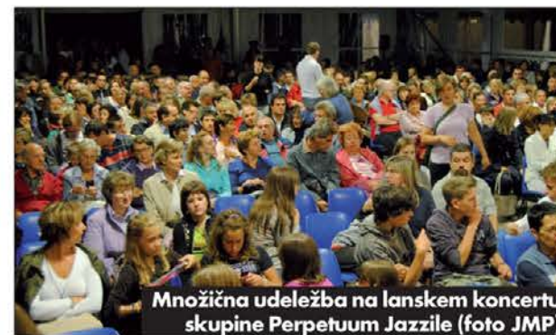
Množična udeležba na lanskem koncertu skupine Perpetuum Jazzile

Prvi nedeljski gost Drage 2011 bo predsednik slovenske Skofovske konference in ljubljanski nadškof dr. Anton Stres, ki je na Dragi že nastopil pred tridesetimi leti in bo daroval sveto mašo za udeležence. Govoril bo o potrebi po novi evangelizaciji danes že seku-