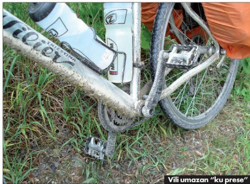
Vili umazan "ku prese"

cej manj sem užival, ko se je kolesarska steza spet približala Donavi in je naenkrat zmanjkalo asfaltirane podlage. Zamenjal jo je od dežja razmočen makadam, po katerem je bilo težje napredovati. Čeprav sem precej zmanjšal potovalno hi-