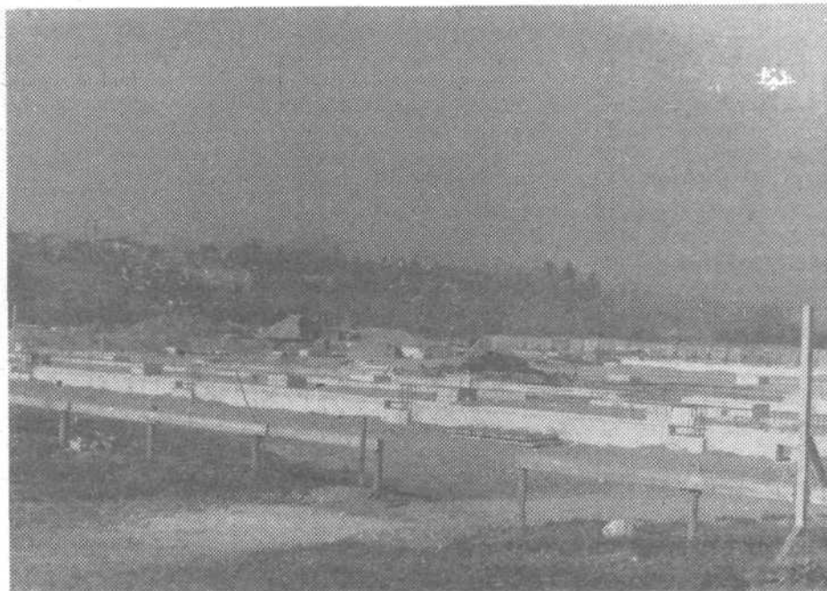
Tale posnetek je z našega gradbišča v občini, oziroma natančneje ob cesti na Brdo »raste« Kemofarmacija

GLASILO OK SZDL LJUBLJANA VIČ- RUDNIK – UREJATA IZDAJATELJSKI SVET (predsednik ing. JANEZ ČEMA- ŽAR) IN UREDNIŠKI ODBOR – MILAN BUH, VASJA BUTINA, JANJA DOMI- TRVIČ (glavna in odgovorna uredni- ca), ANDREJA GOMEZELJ, JANEZ JAGODIČ, IVO ZALAR, tehnični ure- dnik IVAN ŽITKO – UREDNIŠTVO NA- ŠE KOMUNE – LJUBLJANA TRG MDB 14 – TELEFON 28-038 ali 20-728 – TEKOČI RAČUN SDK: 50103-678- 51173 – ROKOPISOV IN FOTOGRAFIJ NE VRAČAMO – TISK ČGP DELO, LJUBLJANA – GLASILO PREJEMAJO VSA GOSPODINJSTVA V OBČINI BREZPLAČNO – GLASILO NAŠA KO- MUNA IZHAJA ŠTIRINAJSTDEKOVNO V NAKLADI 26.000 IZVODOV