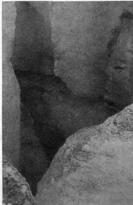
Strašno zeleno in strašno globoko je v ledeniški razpoki, iz globoke razpoke pa se neopremljen planinec ne reši sam