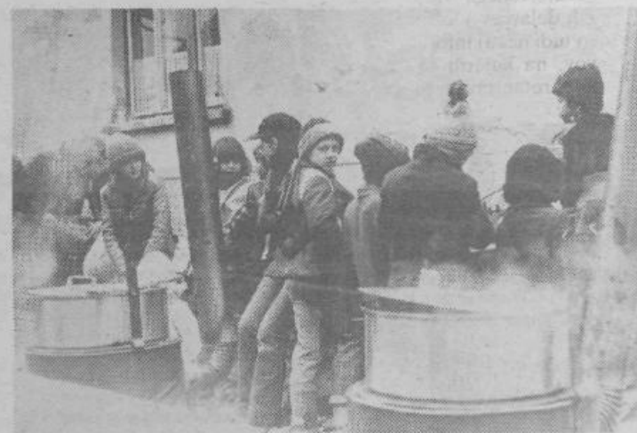
Leta 1980 je bilo na pohodu hladno, zato so se najmlajši udeleženci stiskali ob kotlih, kjer je ob toploti še dišalo po klobasah

Obveščamo vas tudi, da bodo 25. in 26. marca na festivalskem nastopu štafete mladosti prisotni gostje iz bratskih občin Bileće in Plužin ter OK ZSMS Tuzla.