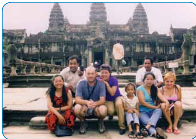
S pajdaši iz Kambodže pred največšo versko zidino na sveti, templon Angkor Vat

začetki leta je furt malo slabše šau posel, té januar pa je biu dober. »Brodim, ka ja tüdi tau fontoško, ka mi skrbimo za naše stranke (ügyfél). Gda oni küpijo mašino, jih mi ne pozabimo. Če