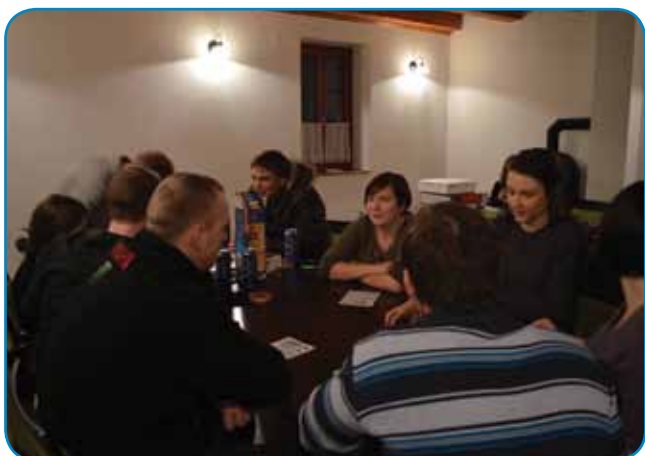
Večer smo končali z družabnimi igrami

saj smo začeli s skupnim ustvarjanjem. Imeli smo gastronomsko delavnico, na kateri smo pekli pice. Na tak način smo se tako punce kot fantje preizkusili v kuhinji, obenem pa smo pripravili lastno večerjo.