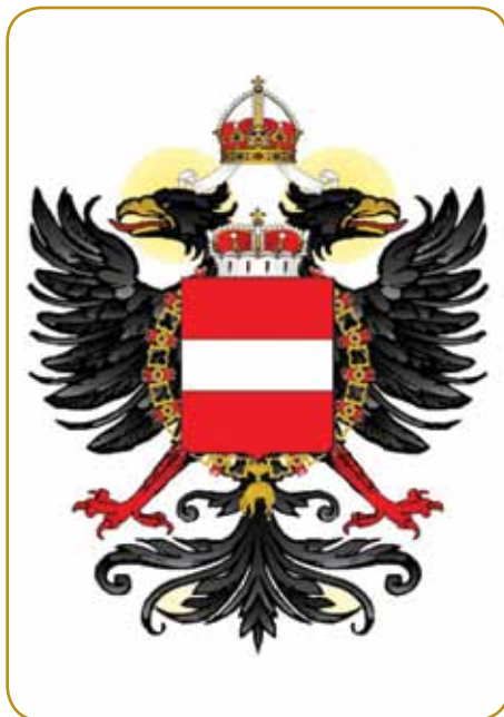
Dvoglavi orel (kétfejű sas) Habsburžanov je do konca prve svetovne bojne nad glavauv Slovincov lejtó

Ime »Habsburg« je rodbina dobila v 11. stoletji, gda je eden od njeni članov daubo grad Habichtsburg (»hájavár«) v Švajci. Flajsno so si dobivali zemlé pa mauč vse do tistoga, gda je njini Rudolf I. grato nemški krau leta 1273. Gda je dojbizu češkoga Otokara , je rodbina oprvin dobila Avstrijo ino Štajersko. Če rejsan so v 14. stoletji zgibili nemški tronuš, so začnili svojo mauč vekšati v takzvani »dedni deželaj« (örökös tartományok). Leta 1335 je Albreht II. daubo Kranjsko pa Koroško, njegvi sin Rudolf IV. pa eške Tirolsko. Prvi njini cesar je grato Friderik III. , šteri je združo avstrijske dežele. Habsburška dinastija je od tistoga mau pa vse