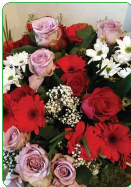
Šopek cvetja, primeren za valentinovo