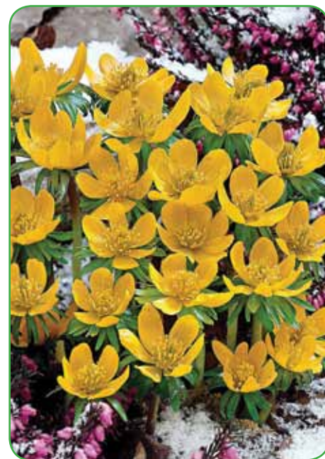
Jarica v družbi z resjem

stresna terapija, pa naj bo na zelenjavnem ali okrasnem.