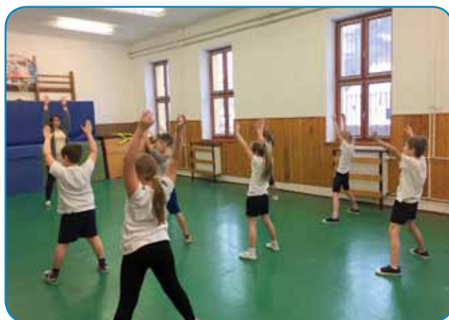
Učenci razumejo skoraj vse slovenske ukaze v telovadnici

smo dejansko na šoli. Ko v razredih izvajamo pouk. Kolegice mi veliko pomagajo, mi svetujejo in tudi otroci so prijazni. Zelo jim je všeč, da lahko vse razložim v slovenščini in tudi takoj v madžarščini.