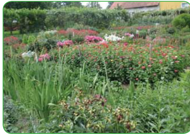
Babičin vrt z zelenjavo in cvetjem

ženskah v zrelih letih pa naj bi raziskave pokazale, da upočasnijo razvoj osteoporoze. Z vrtnarjenjem širimo svoj socialni krog - srečujemo sosede, razpravljamo o trdovratnih