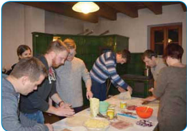
Tako smo pripravljali pice

Zbrani smo se dobili zvečer ob šesti uri in smo najprej zasedli kuhinjo,