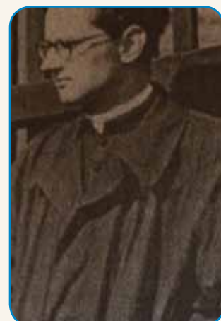
Spominsko leto Jánoša Brennerja stran 10