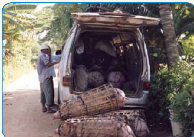
Odavle redline po cejlom svejti stran 4