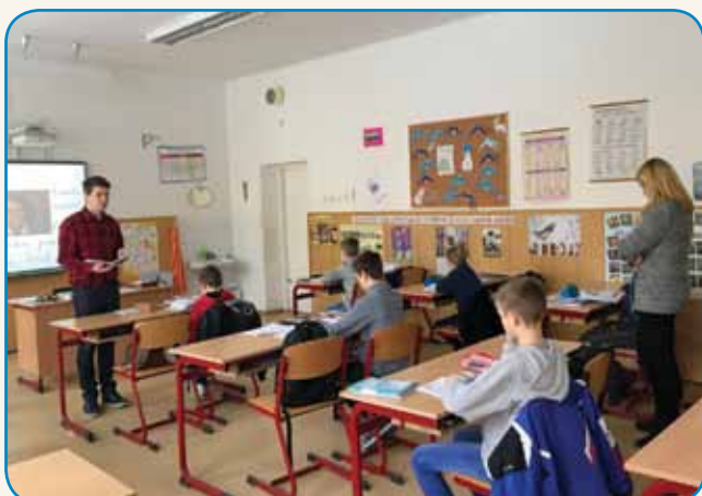
Nova mlada pedagoga na seniški šoli stran 3