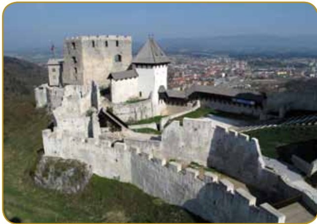
Najvejši srednjeveški grad kralüje nad »knežim varašom« Celjom

li z vsejmi čestmi kak liki vladare. Biu je stric od mladoga vogrskoga krala Ladislava (vnükeka Barbare), od šteroga skrbnik je sto gratati pa tak istinski vladar Vogrskoga kraljestva. Madžarski velikaši so ga nej steli blüzi tronuša svoje domovine meti, zatok so se vküper z Ladislavom Hunyadinom zakunili, ka ga vmorijo. Leta 1456 se je atentat v Beo-