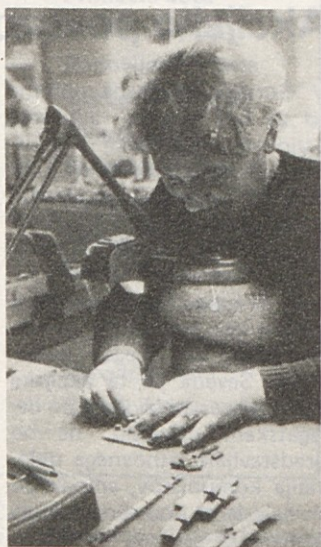
Začetek izdelave dekoderjev za teletext v obratu Gorenja Elektronika Široka potrošnja.

Potem, ko so sodelavci razvojne službe Gorenja Elektronika Široka potrošnja v sodelovanju s strokovnjakoma Gorenja Koerting v ZRN, doma razvili dekoder za teletext, je sedaj ta naprava že v redni proizvodnji. Z izdelavo dekoderjev so začeli 12. novembra in predvidevajo še letno skupno proizvodnjo 5000 kosov teh modulov. Dekoderje vgrajujejo v barvni televizijski sprejemnik marathon 809 ttx in kupci teh aparatov že lahko spremljajo teletext preko Televizije Ljubljana, ki posreduje najrazličnejše informacije, kratka poročila, športne rezultate in druge podatke. S pomočjo daljinskega upravljanja lahko v katerem koli času poiščete informacijo, ki te zanima.