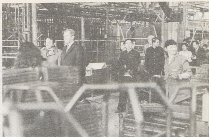
Gostje iz Kitajske so si z velikim zanimanjem ogledali proizvodnjo bele tehnike Gorenja (na sliki ogled proizvodnje Galvane).