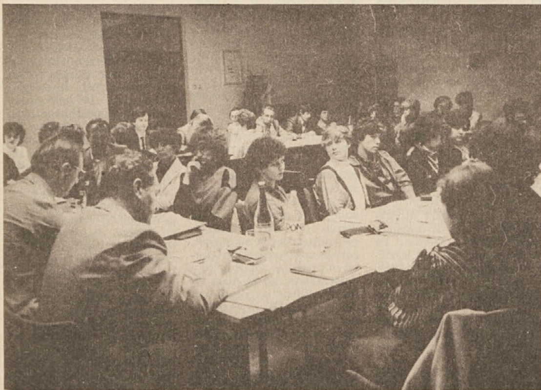
Na zadnji seji konference sindikatov v krški Libni. Več o konferenci pišemo na drugi strani.