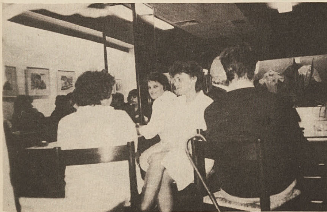
Po sindikalnih skupinah je tekla razprava o aktih s področja delitvenih razmerij in še posebej o dodelanih razvidih del in nalog, o predlagani metodi vrednotenja dela in o metodi uspešnosti dela. Posnetek je iz druge sindikalne skupine v DSSS.