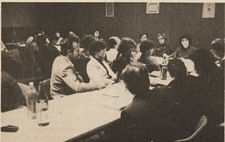
S konference sindikata naše DO.

Zveza socialistične mladine Slovenije je množična družbenopolitična in vzgojna organizacija, v katero se mladi in njihove organizacije prostovoljno združujejo in organizirajo, da bi s svojo dejavnostjo pripomogli k nadaljnjemu samoupravnemu socialističnemu razvoju Slovenije in Jugoslavije, uresničevanju enakopravnosti, krepitvi bratstva in enotnosti narodov in narodnosti, obvarovanju svobode, neodvisnosti in neuvrščene politike Jugoslavije.