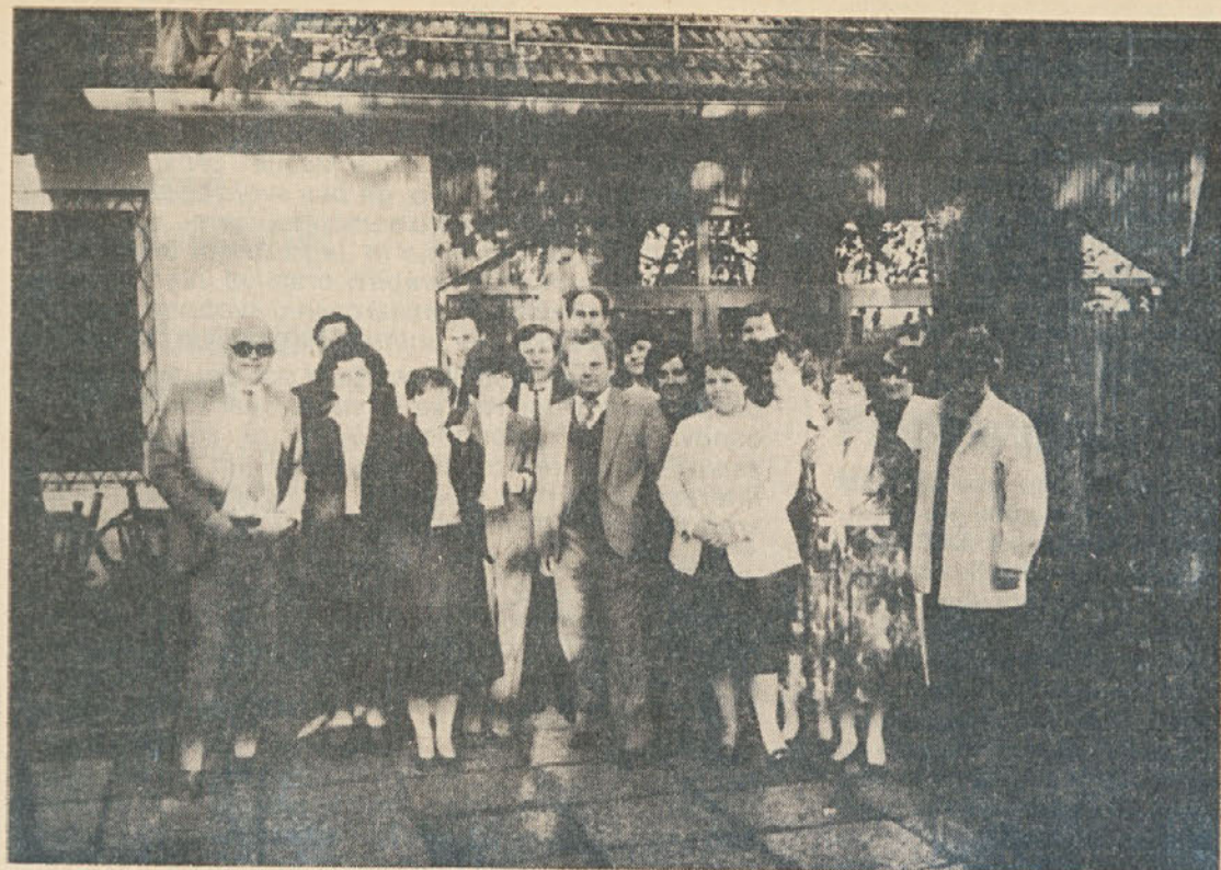
Zvezni nagrajenci tozdov Ločna, Commerce in DSSS s predstavniki delovne organizacije.