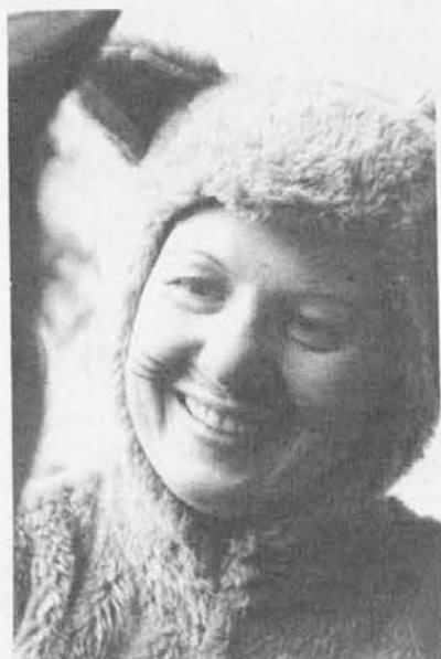
Rodda 1981: a Carnevale basta poco per essere maschera.

te ufficialità. In quanto profana non è certo stata tutelata dalla Chiesa che in vari periodi storici l'ha invece aspramente contestata; non si può considerare al pari una festività civile, poichè, nonostante celebri un passaggio (la fine dell'anno vecchio con l'inverno e l'inizio di quello nuovo