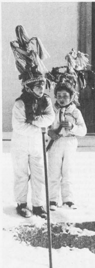
Montefosca 1984: due piccoli mascherati, una speranza perchè continui a vivere la tradizione dei blumari

Un tempo il Carnevale interessava un periodo assai più vasto ed è sufficiente andare indietro con la memo-