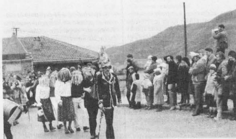
Lansko pustovanje v Mažerolah se bo letos ponovilo v Špetru