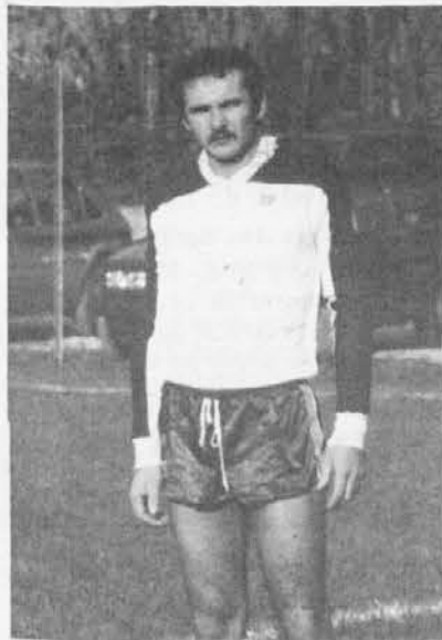
Gianfranco Stulin dell'Audace