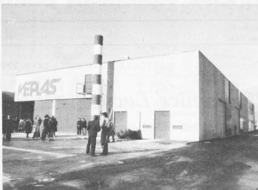
Podjetje Veplas v Ažli

All'uomo delle Valli, quindi, è stata bloccata ogni possibilità di crescita culturale e di promozione umana. L'uomo della Benecia ha accettato uno stato di fatto statico e subito con passiva rassegnazione gli eventi della storia, decisi per noi da altri, da gente estranea ed esterna alla realtà locale, che hanno sempre tentato di imporre una politica coloniale di penetrazione e di controllo dell'economia e delle co-