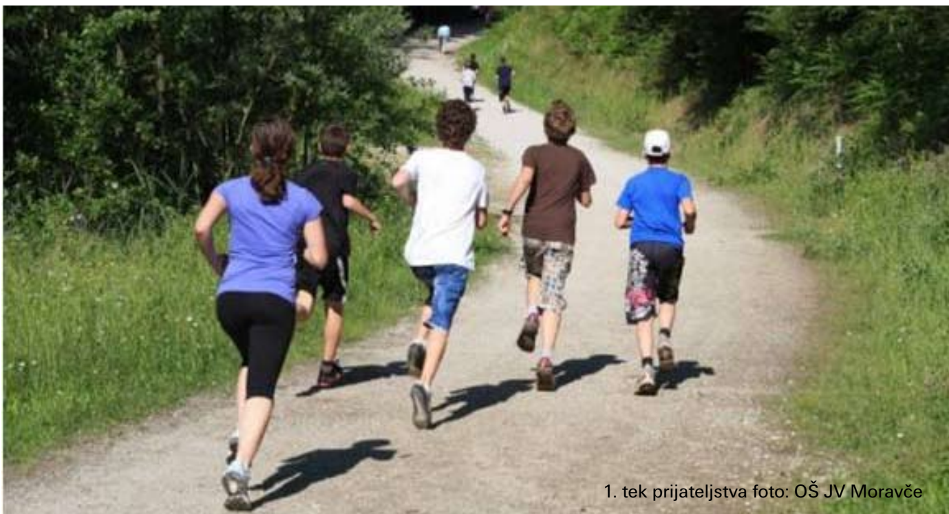
1. tek prijateljstva

štev prijavi na razpis in ga pridobili. Ker sem na fakulteti usmerjala športno rekreacijo mi je zdrav način preživljanje prostega časa blizu in je zato projekt še dodaten izziv pri rednem delu v šoli.