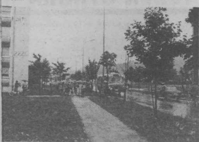
Jesenski dež, solarji s starši in avtobus.