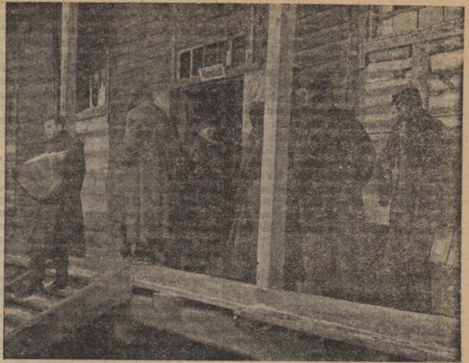
Hochbetrieb im Verpflegungsamt. Hier empfangen die Einheiten des Heeres Verpflegung und Lebensmittel, die in großen Mengen auf dem Schienenwege aus der Heimat herangebracht werden

Im allgemeinen ist es natürlich immer der Ziel, daß erstens etwas gear-