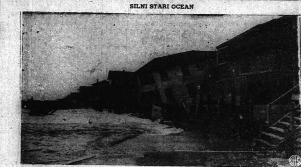
Viharji so razburkali morje, ki meče svoje valove daleč po obrežju ter izpodkopa polsetno letovišne hiše na Long Beach, Long Island, N. Y. Kasneje so napravili tukaj zasilne pregraje ali jekove, ki zadržujejo valove.

Politični opazovalci so mnenja, da edino spopad s Turki, bi znal oživet bolgarski zavest in moralo. Zato so mnenja, da znajo Nemci poizkusiti zaplesti Bolgare v boj s Turki. S tem bi pridobili začasno dvojno. Dvignila bi se morala bolgarskega naroda, drugič dobili bi priliko za vpad v evropsko Turčijo in zasedbi Carigrad in vsa obrežja ob Dardanelah. Seveda, če bo zavezniško orožje to dopustilo?