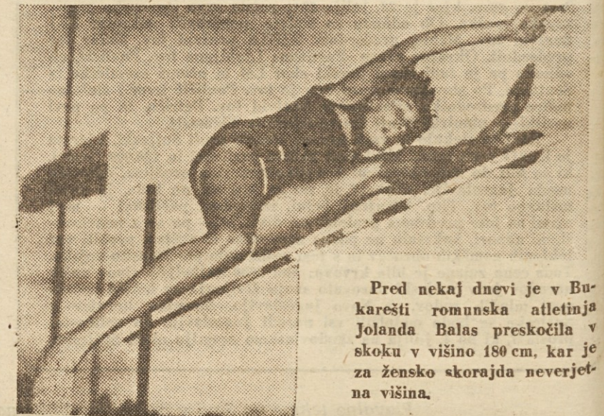
Pred nekaj dnevi je v Bukarešti romunska atletinja Jolanda Balas preskočila v skoku v višino 180 cm, kar je za žensko skorajda neverjetna višina.

Do 11. minute prvega polčasa so vodile Branikovke z razliko nekaj košev. Kasneje je Olimpija močno pritislila, izenačila rezultat, izsilila vodstvo in odločila prvi del igre v svojo korist. Tedaj so bile igralke Olimpije precej boljše ter so zlah-