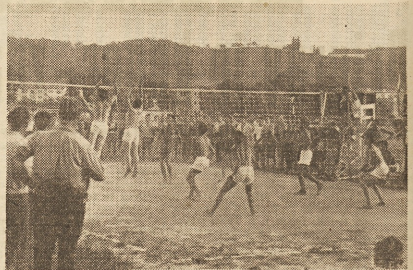
Lani so delavci elektrogospodarskih podjetij priredili letne igre v Novi Gorici, kjer je bilo mnogo zanimanja zlasti za tekme v odbojki

■ Bežigrad: na velikem stadionu Odreda je vse »preorano« — ne zato, da bi posejali krompir ali koruzo, marveč za angleško travo. Pravijo, da do prihodnje spomladi ne bodo pustili na stadion nobenega nogometišča, rokometišča ali metalca. Glavno poslojje na stadionu je precej potrebno popravila, zlasti streha, ki jo razjeda zob časa. Pač pa smo opazili na teh objektih tudi precejšnjo malomarnost gospodarjev, saj na vrhu strehe krepko poganja že kar čedno drevje. Menda se je na strehi zaradi »marljivosti« gospodarjev nabrala cela plast humusa. Tudi pri sosedih v jami, kjer je bežigradska šola in bežigrasko partizansko društvo, smo opazili podobne znake slabega gospodarjenja (polno smeti, papirja in drugih odpadkov, ki so razmetani po okolici), kar daje tamkajšnjim telesnovzgojnim delavcem kaj slabo spričevalo. I. P.