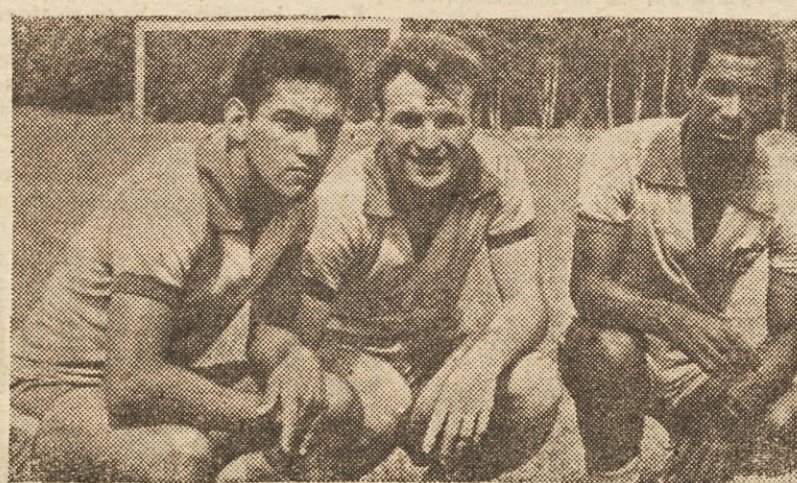
Vsem svojim nasprotnikom je delala največ preglavic brazilska napadalna trojka Garrincha, Mazzola in Didi