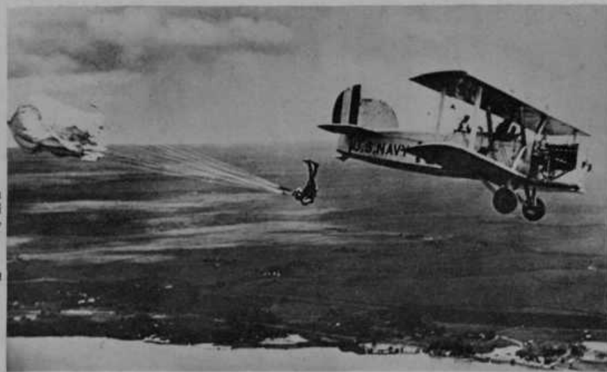
Skok iz letala. Kakor imajo ladje za slučaj nesreče, da se ladja potopi, pripravljene rešilne pasove, ki vzdržijo človeka tudi več dni na površju vode, tako imajo letala za slučaj nesreče pripravljena padala, s pomočjo katerega se spusti letalec oz. polnik na zemljo. Padalo je podobno ogromnemu dežniku, ki se v zraku sam odpre ter se polagoma spušča navzdol. Skakalec sedi na majhnem stolčku, ki je z močnimi motvozmi privezan na padalo.

je v gradu na Igu. sa krajih približno umre.