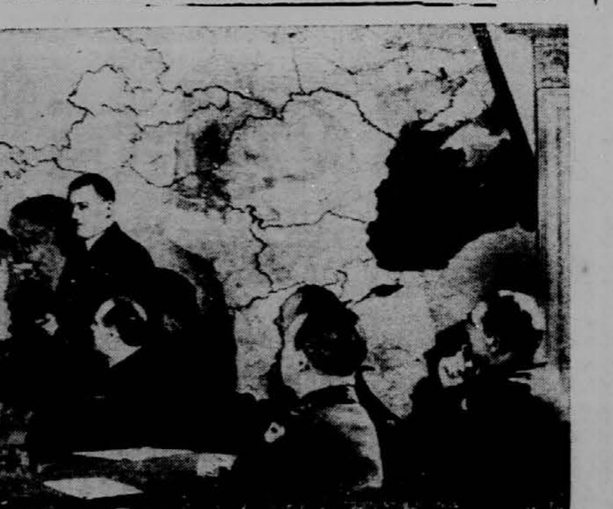
Poveljniki zavezniške zračne sile proučujejo zemljevid Evrope ter izdelujejo načrte za nove zračne napade na Hitlerjevo trdnjavo.