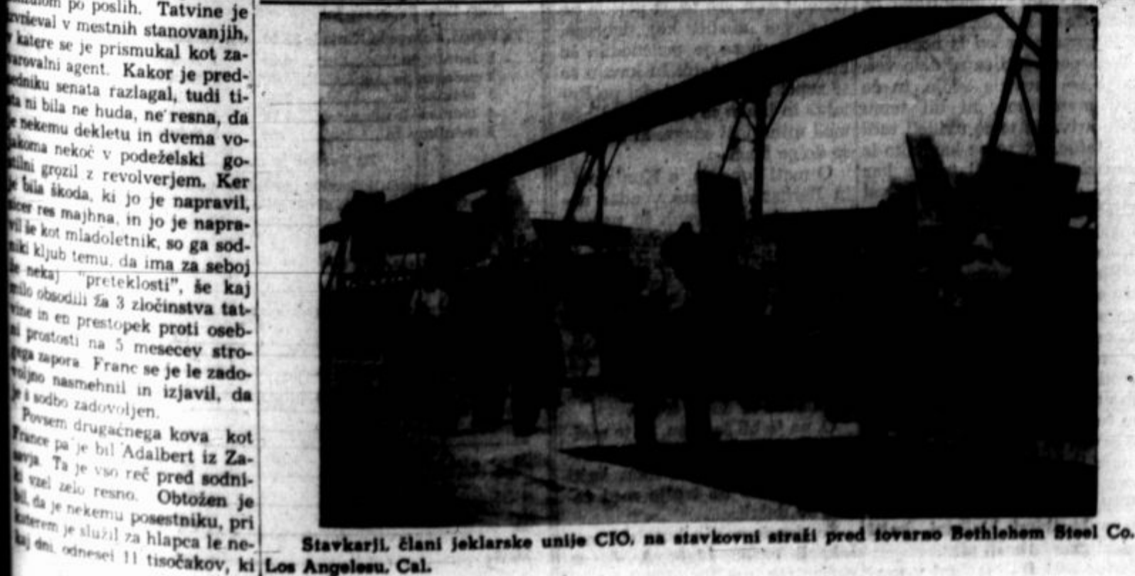
Stavkarji člani jeklarske unije CIO, na stavkovni straži pred tovarno Bethlehem Steel Co. v Los Angelesu, Cal.

Naročila sprejema PROLETAREC 2301 SO. LAWDALE AVE. CHICAGO, ILL.