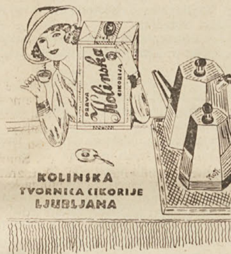
KOLINSKA TVORNICA (IKORJE) LJUBLJANA

Edini slovenski tednik za radiofonijo »RADIO - LJUBLJANA« ki naj bo v hiši vsakega sportnika. Naroča se pri upravi, Ljubljana, Mahničeva 12, tel. 3290.