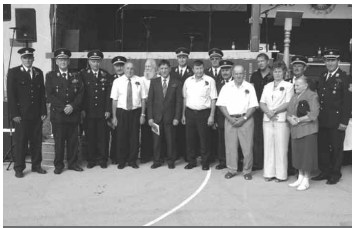
Utrinek s slovesnosti PGD Sobotinci