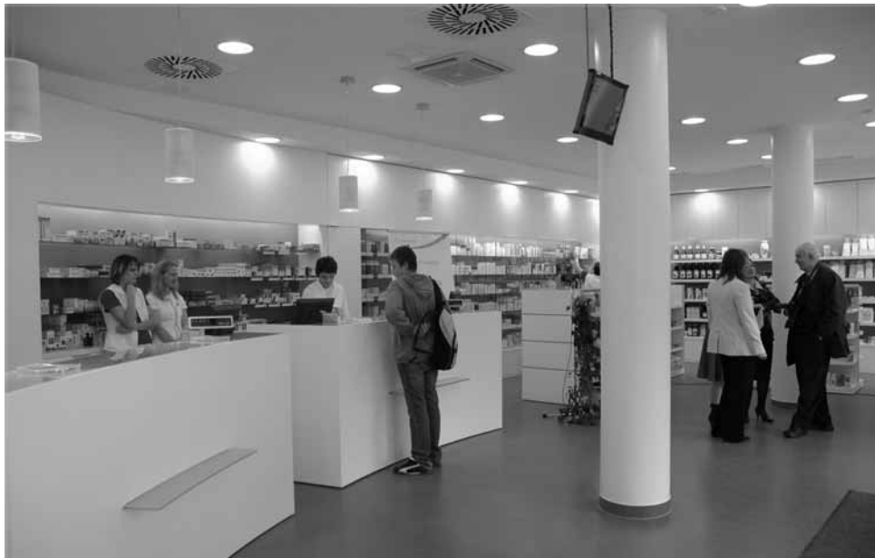
Ptujske lekarne v tem letu praznujejo 50 let.

Ob pomoči kolektiva Lekarne Ptuj se je na širšem območju širila mreža lekarn. Najprej v Majšperku, nato v Kidričevem in leta 1975 še v Ormožu in Središču. Slednji dve enoti sta se kasneje odcepili in nastal je samostojen zavod - Lekarna Ormož. V Lekarnah Ptuj pa smo še naprej širili lekarniško mrežo in približevali dejavnost preskrbe z zdravili prebivalcem. Nastale so nove lekarne: Lekarna Gorišnica, Lekarna Breg in Lekarna Budina - Brstje na Ptuju, lekarniška podružnica Videm pri Ptuju.