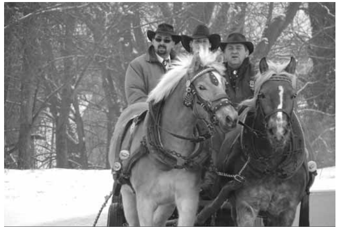
Konjeniški klub Nova vas je iz rok Turističnega društva prejel posebno priznanje za promocijo turizma.