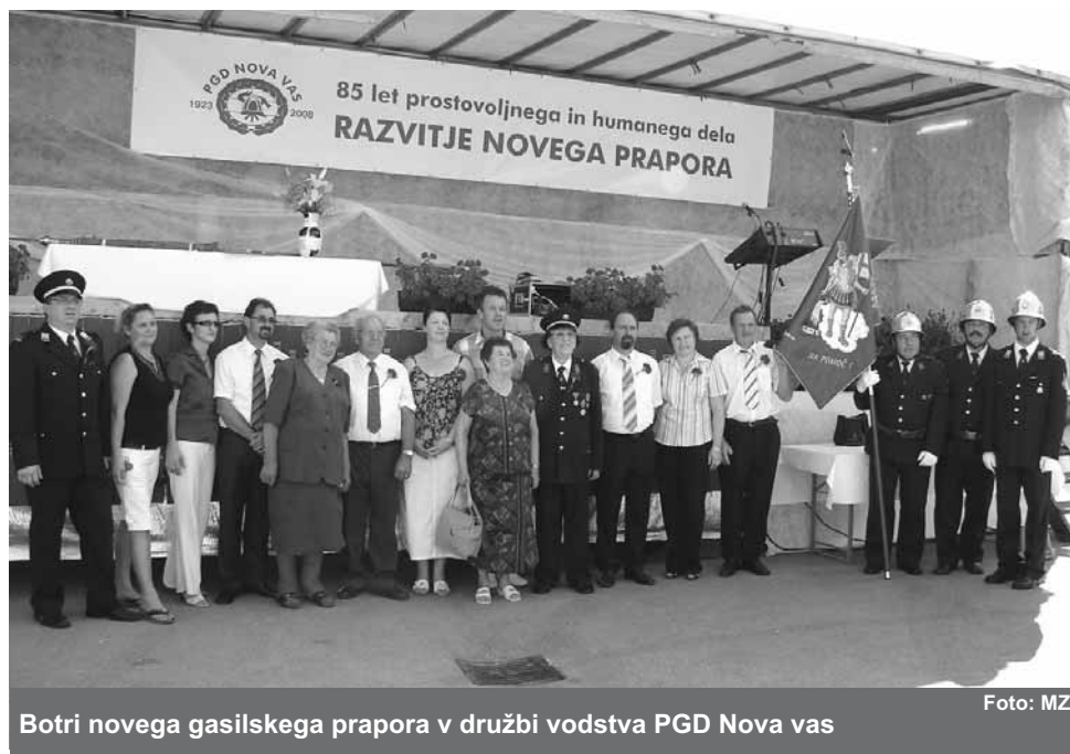
Botri novega gasilskega prapora v družbi vodstva PGD Nova vas

Društvo je nato pristopilo h gradnji gasilskega doma. S težavo so se uskladili, kje naj stoji. Za Novovaščane je bila primerna lokacija v središču vasi, kjer stoji sedanji. Ker