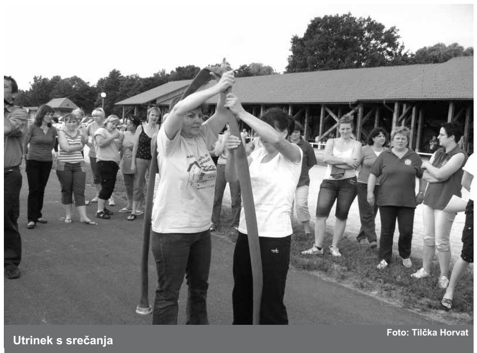
Utrinek s srečanja