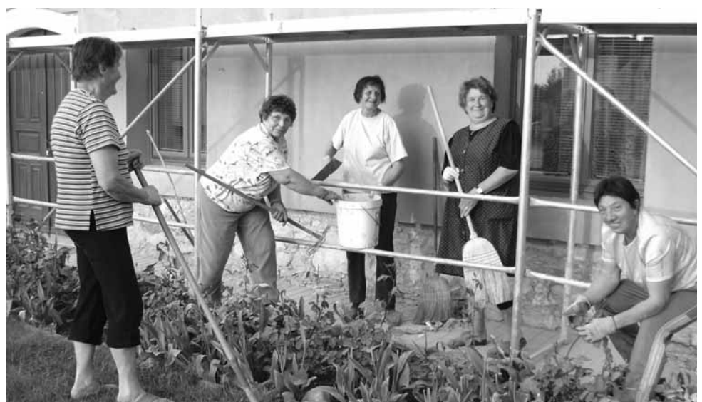
Gospodinje, ki so priskočile na pomoč g. župniku pri urejanju okolice župnišča.