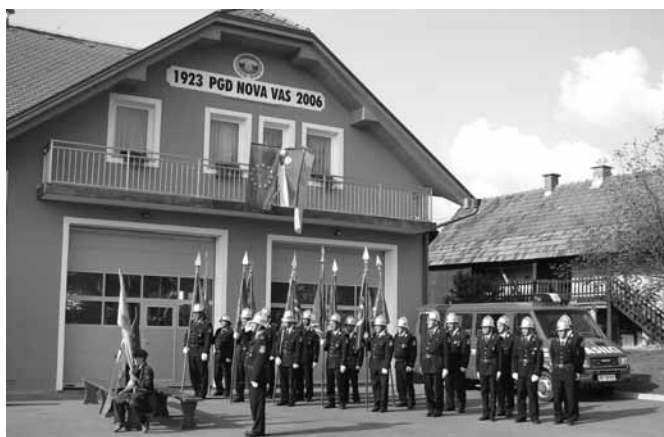
Gasilsko - vaški dom Nova vas je po mnenju strokovne komisije najlepše urejeni vaški objekt.