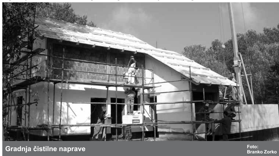
Gradnja čistilne naprave

Na javnem razpisu za izvedbo III. faze kana-