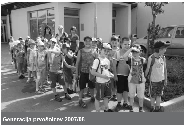
Generacija prvošolcev 2007/08

Ob tem smo se tudi naučili, kakšna pravila veljajo v šoli, kako se obnašamo do sošolcev, učiteljev in drugih v šoli in izven nje. Predvsem pa smo občutili, da smo skupina, v kateri je vsak odgovoren in enakoveren. Dobro pripravljeni za drugošolske podvige smo prepustili mesto prvošolcev »ta malim«, ki so septembra sedli v šolske klopi.