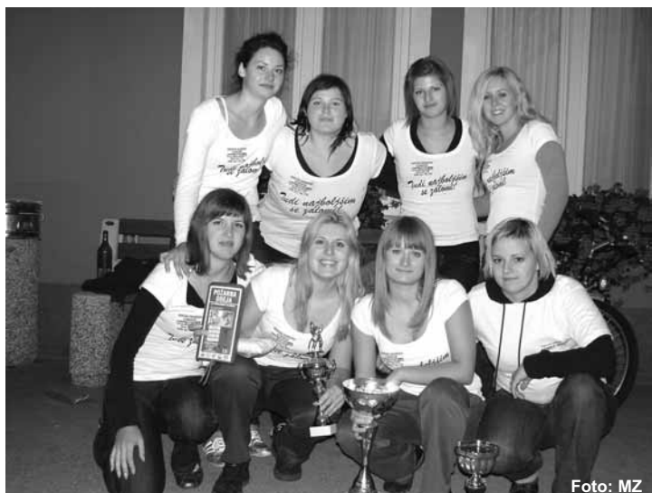
Članice PGD Nova vas so v ligi 2008 zasedle drugo mesto.