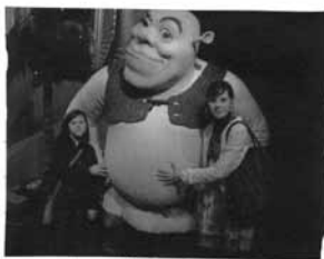
muzej voščernih lutk