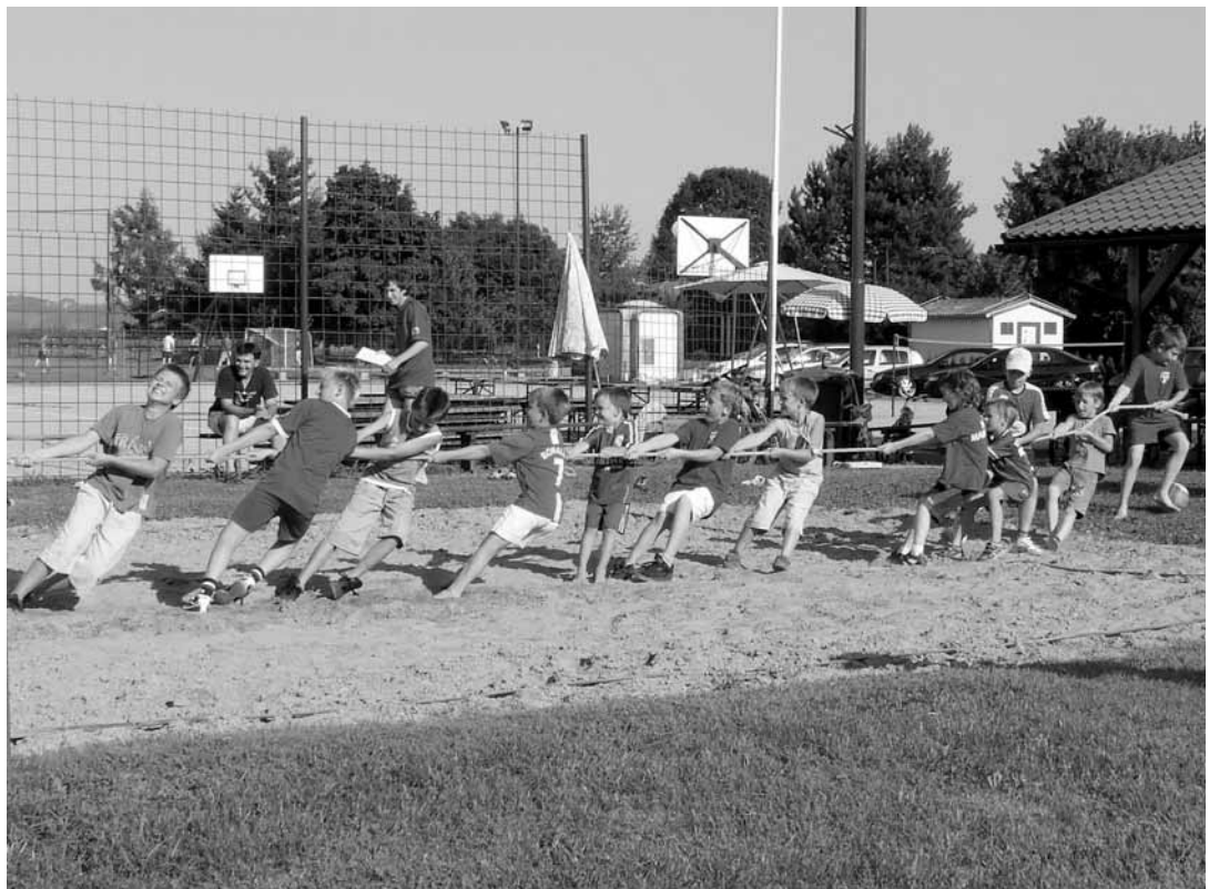
Vlečenje vrvi U8 in U10 proti mamicam