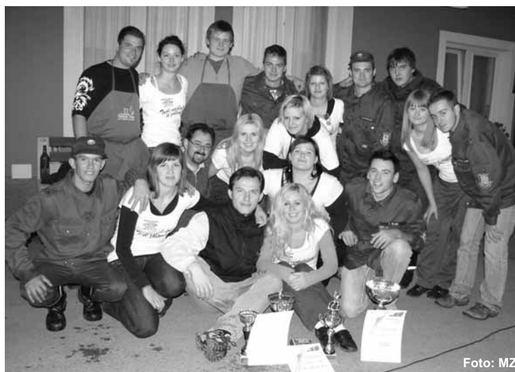
Zaključek ligaških tekmovanj je minil v veselem vzdušju.