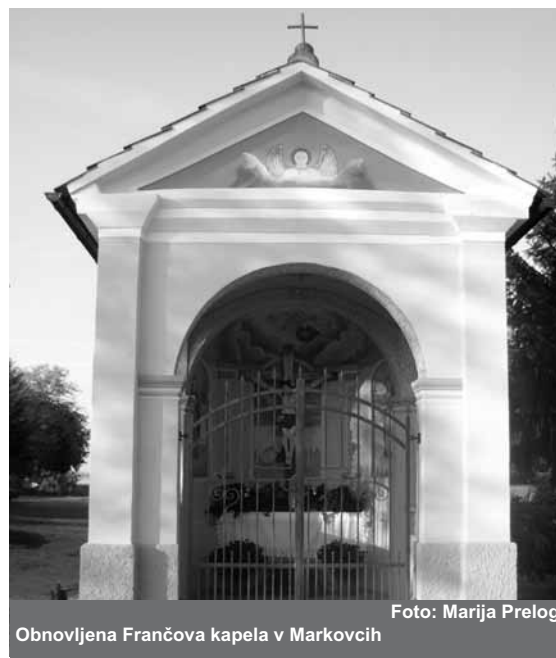
Obnovljena Frančova kapela v Markovcih