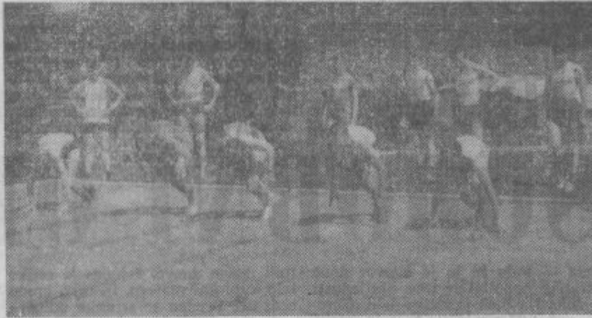
Mladi atleti na startu.

Met kroglice: 1. Branko Nagode — 12.12, 2. Matjaž Klemenčič — 11.96, 3. Milan Kovač — 11.86.