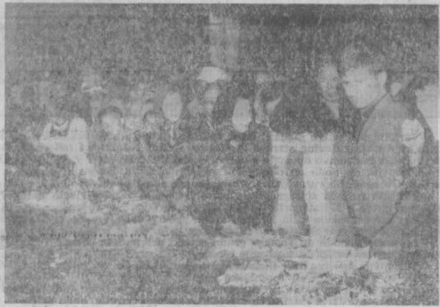
Slovo od tragično preminullih rudarjev.