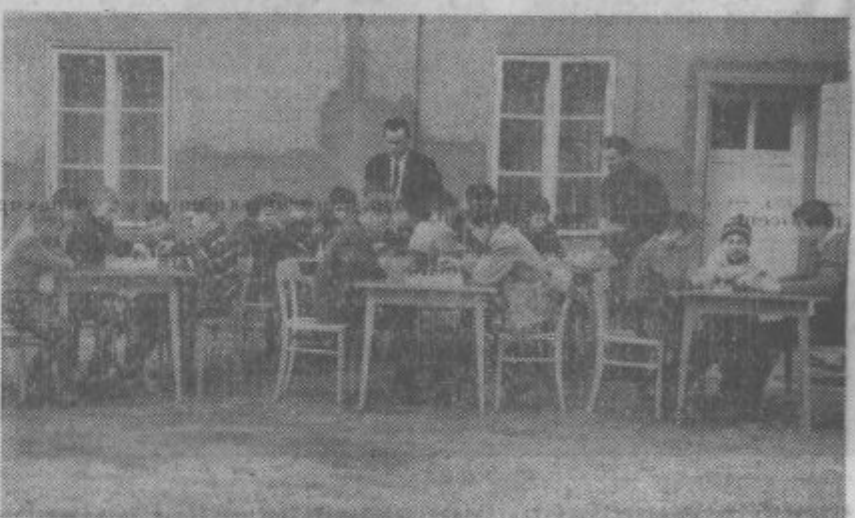
Mladi gasilci večkrat priredijo medsebojna srečanja na katerih se pomerijo v gasilskih veščinah in tudi drugih panogah. Na sliki vidimo medsebojno srečanje pionirskih desetih industrijskega gasilškega društva RLV in GD Smartno ob Paki, ko igrajo šah.

Prošnje pošljite na splošno službo Chrom-metal Velenje do vključno 30. 6. 1966.