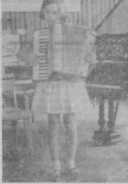
Gojenka na javnem nastopu glasbene šole.