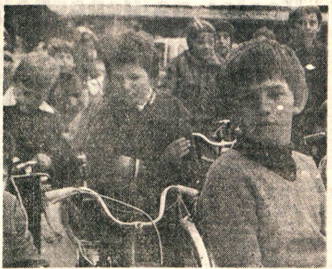
Mladi se urijo v prometni vzgoji

Uspešen tečaj v osnovni šoli Komenda-Moste