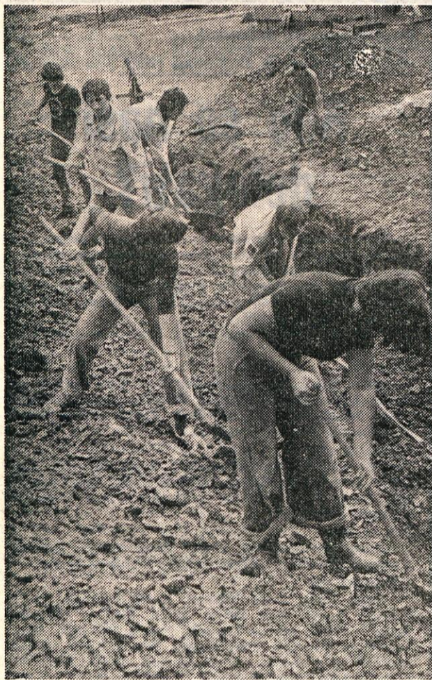
Na mladinski delovni brigadi