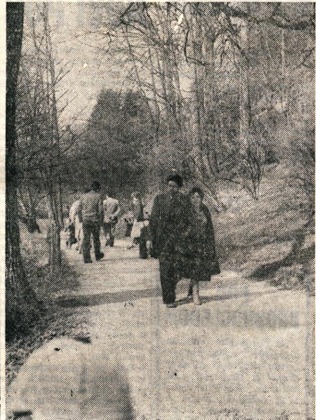
Tudi sprehod v urejenem parku je prijetnejši