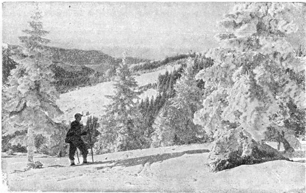
V zasneženih hribih

Na novo blagoslovljena sveča naj nam vsem ožari njegovo skrito življenje! Da ga razumemo in posnemamo!