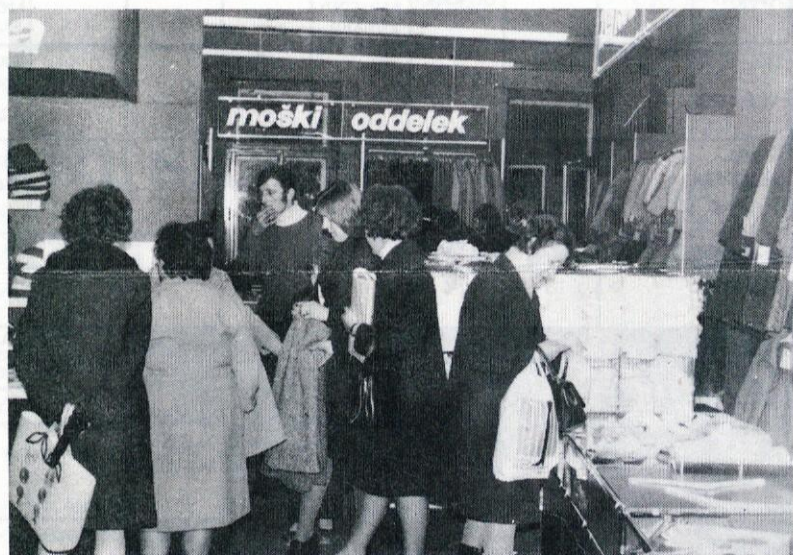
V samem centru Vrhnike: blagovnica Mercator