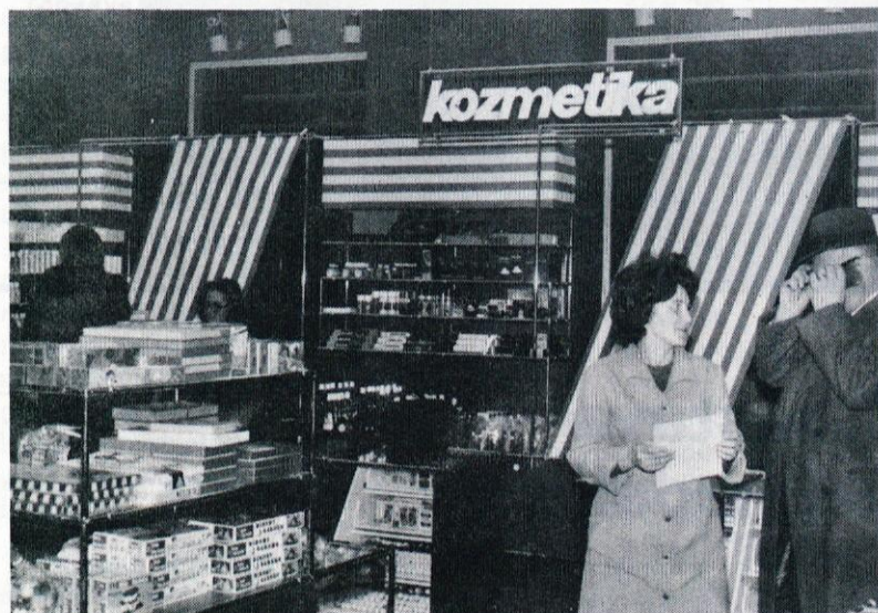
Notranjost blagovnice je sodobno opremljena, blago pa razporejeno na posamezne oddelke.