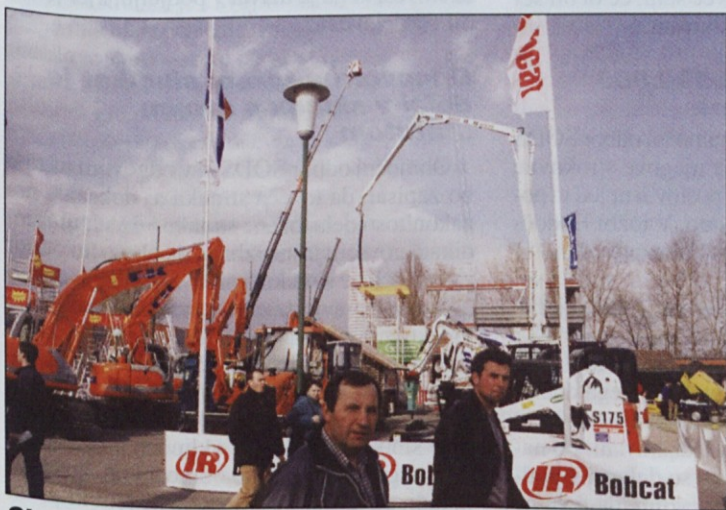
Slovenski gradbeniki bodo morali povečati tudi izvoz.