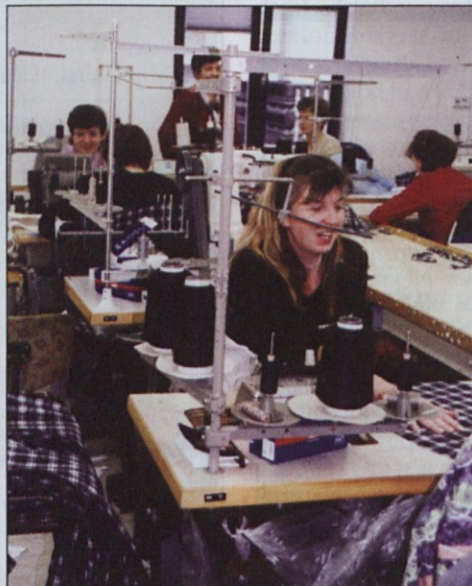
V obratovalnici Nana so vsi zaposleni člani sindikata.

Resnici na ljubo pa je treba reči, da naša davčna zakonodaja Vešligaju pri pripravah na morebitno opustitev dejavnosti ni v pomoč, velja prav nasprotno. Naša davčna zakonodaja samostojnim podjetnikom ne omogoča, da bi varčevali in več let dajali denar na stran za to, da bi v določenem trenutku lahko poravnali svoje obveznosti do delavcev. Dejansko morajo