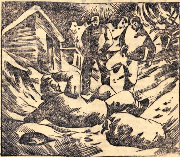
116. »Kje pa je druga vreča?« je na slepo srečo vprašal Kriš. »Ni je več, sem pojedel.« se je glasno vedno resnično odgovor. »Požrl si ga!« je besnel Cok. »Polno vrečo si sam požrl, medtem po so tvoji tovariši umirali zaradi pomanjkanja krompirja!« Izdatne brec so prillile Wentwortha k molku.