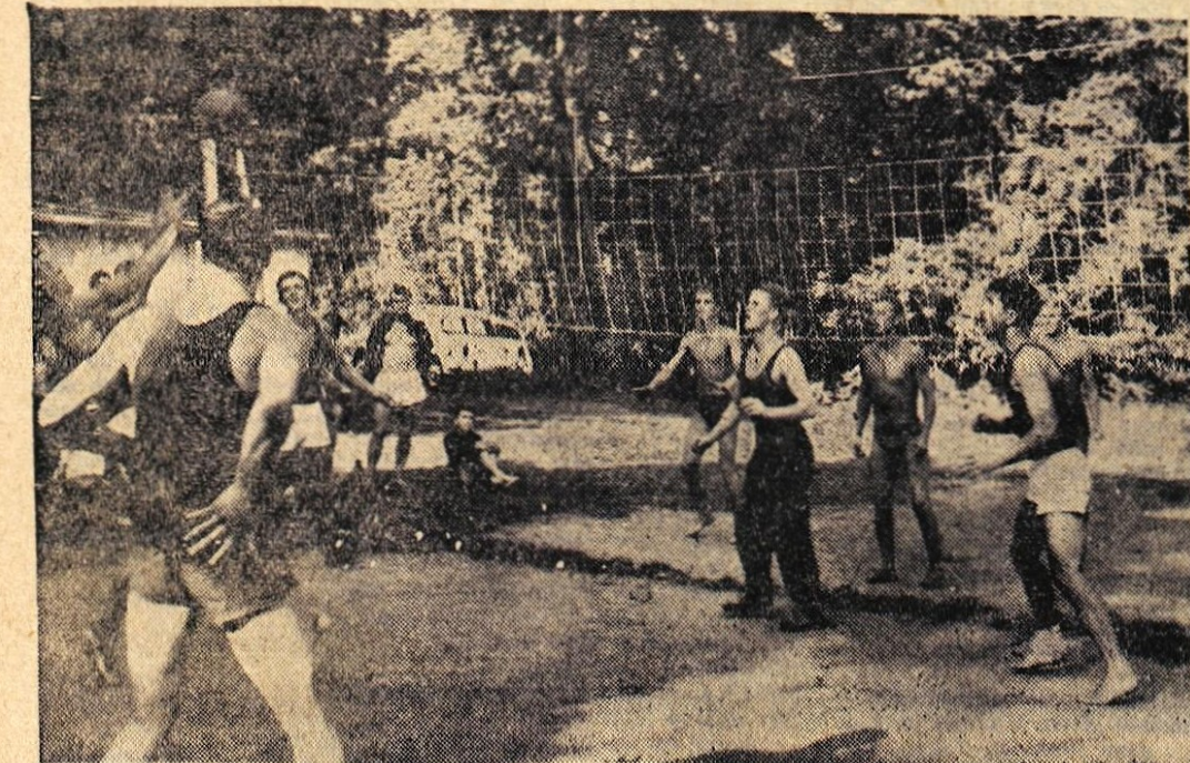
Prizor z odbojarskega srečanja brigadirjev, vojakov in tabornikov minuli petek v Kranju

V odbojki so vojaki kranjskega garnizona premagali tabornike iz Splita z 2:0, uspešni pa so bili tudi vojaki zagrebskega garnizona, ki so z rezultatom 2:1 porazili brigadirje, čeprav so slednji vodili že z 1:0 — J. J.