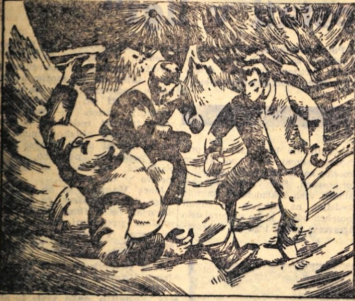
115. Kriš in Cok sta planila. Udarci so se začeli vsipati nanj s leve in desne. Wentworth se je zgrudil. Kriš je začel odpirati vrečo; v njej je bil krompir. Stari lisjak je začel prostiti na kolnih: »Jurij sem ga vama hotel izročiti! Samo deset mi jih dajta! Samo pet! Krompir, to je življenje!«