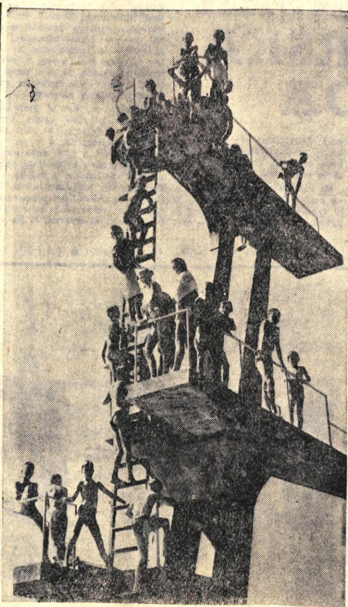
Skoki v vodo imajo pri nas dokaj lepo tradicijo, kljub temu pa iz leta v leto lahko ugotovljamo, da je športnikov, ki bi z odskočnim desk ali stolpov skakali v vodo, vedno manj. Prav gotovo je največji vzrok za to, da je trenutno v Sloveniji več skakalnic kot aktivnih skakavcev, pomanjkanje trenerjev in instruktorjev za to lepo športno panogo. Včerajšnja prireditve na Jesenicah bo morda tamkajšnje mladino spodbudila, da bodo skakalnico bolj »zaposlili« kot je bila doslej. Lepe možnosti za gojenje skakavcev imajo tudi v Radovljici (na sliki), kjer se pogumni otroci sicer poganjajo z lepega stolpa, vendar tam ni nikogar, ki bi se za njihovo vzgojo resneje zavzel. — J. Z.