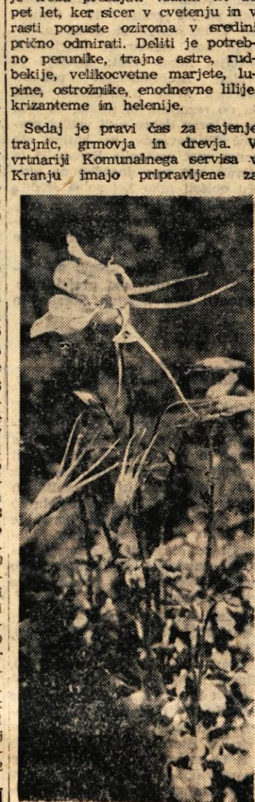
Ljubitelje mnoge lepe trajnice. Za sajenje na grede priporočamo nekaj višje trajnice, posebno še modre in bele ostrožnike, raznobarvne lupine, orlice, gloksinijam podobne rožnate inkarville, trajne astre, perunike, tritome, od prtičnikih trajnic, ki so primerne za zasaditev terasastih vrtov,