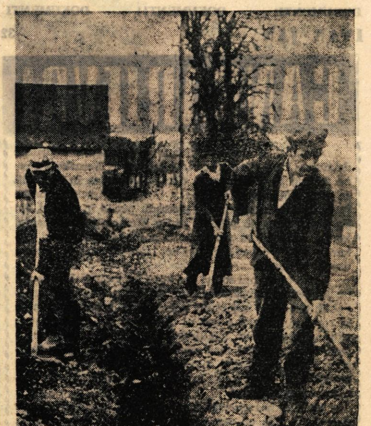
Prebivalci na levem bregu Save od Prebačevega do Smednika so dobili vodovod. Te dni so zasipavali jarek, kjer je položena glavna vodovodna cev. Naloga je sedaj, da posamezni stanovalci v krajih ob novem vodovodu napeljujejo še priključke do svojih hiš in stanovanj (M. Z.)

Škarp, skaljnakov, ozkih cvetličnih obrobkov in grobov pa so posebno hvaležni rumeni grobeljniki (Alyssum), raznobarvne homuljice (Sedum), zimzelena iberis, prtičniki floksi, modre aubriecije, rožnato ali rdečecvetno soncece (Helianthemum), arabske šmarnice, pa še mnoge druge. Izbera je že precej obširna, zato bo vsakdo lahko izbral primerne cvetice za svoj vrt. Na zalogi imajo pa tudi sadike drevja in grmičevja. Za živo mejo, s katero popolnoma nadomestimo drage zidane ograje, je primeren liguster. Morda bi se vzdolj meje bolje podala prostoročja živica forsitije, vajgele ali metaljevke, ali pa lepa in docela neprehodna meja ognjenega trna. Ob cesti pred hišo ne sadimo visoke meje, tja bi se morda prilagal bolj nizak obrobek iz rdečelistnega česmina ali prtičkave spireje. Vse to najprej dobro premislimo, šele nato naročimo in sadimo, saj bo vsaka napaka, ki jo pri tem zagrešimo, vidna šele po letih, ko se meja popolnoma razvije. Kdor pa vrt pravkar ograjuje, naj prav tako premisli. Z mrežo in betonom ograjen vrt ne pridobi na lepoti, saj vrt potrebuje zelen okvir, ki mu ga daje žive rastline. Za prihranjen denar pa bo lahko ves vrt vzorno urejen.