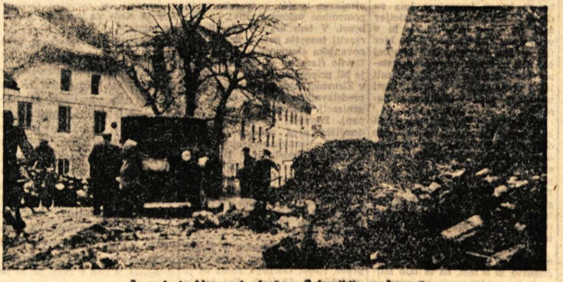
Se malo in klanca ob plavžu v Železnikih ne bo več

tudi njive ne bodo pri tem prizadete. Gradnja plinovoda bi morala biti končana do konca 1964. leta. Takrat bo končana tudi veleplinarska v Velenju in bodo potrošniki lahko takoj dobivali plin. Načrti za odjemalne postaje niso še izdelani. To bodo morali narediti predstavniki industrije in ljudskih odborov za določena območja. Doselej je samo Železarna na Jesenicah kot odjemalec. Predvidevajo pa, da bo industrija tudi na Gorenjskem iskala ta vir energije in toplote, ki bo znatno cenejši kot doselej. Tudi projektanti novih stanovanjskih naselij oziroma hiš morajo v novih načrtih upoštevati nov, cenejši način centralnega ogrevanja s plinom.