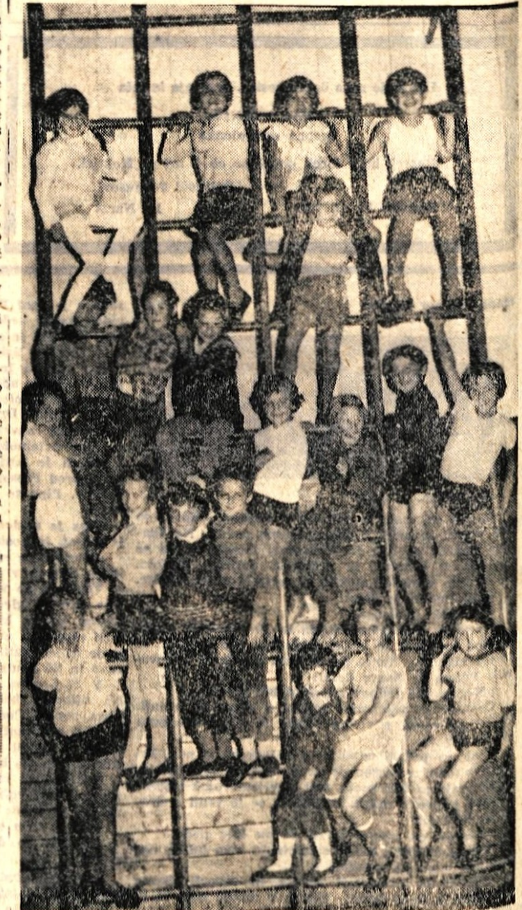
Brez telovadnic bo problem sistematične telesne vzgoje na šolah ostal nerešljiv