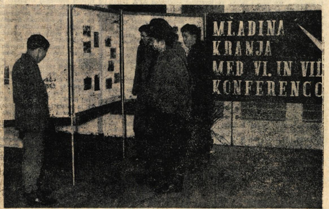
KRANJ (M. Z.) — Ob VII. konfe renci Občinskega komiteja LMS Kranj, ki je bila večeraj so v dvorani Delavskega doma (vhod 6) odprli tudi razstavo, ki prikazuje delo in življenje mladine v kranjski občini med VI. in VII. konferenco

Mimo dejstva, da se je letos število nesreč na poti na delo in iz dela povečalo, ne moremo in ne smemo samo z ugotovitvijo. Promet na naših cestah namreč stalno narašča, saj je samo na Gorenjskem približno tri tisoč motopedov, nad 50 tisoč dvokoles, stalno pa se veča tudi število motornih koles in avtomobilov. To je sicer razveseljivo, v obravnavanih primerih pa tudi zaskrbljujoče. Zato bo treba nedvomno temeljito proučiti, kako bi zagotovili varnost na cesti in s tem tudi varnost delavcev na poti na delo. Verjetno bo tudi v tem primeru najuspešnejša vzgoja ljudi in stalno opominjanje, naj vedno vedno varujejo na cesti in drugod sebe in sotovariše — J. P.