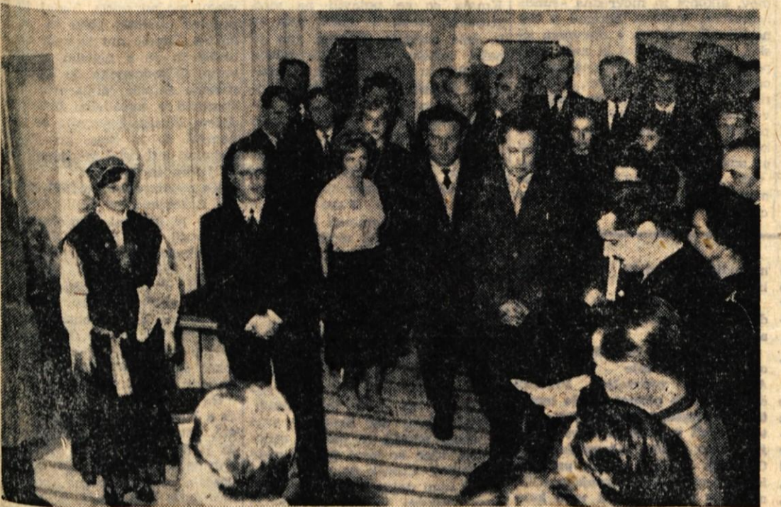
Z otvoritve nove pošte v Radovljici

Se nadalje pretežno oblačno s postopno ohladiitvijo in snežnimi padavinami v višjih legah.