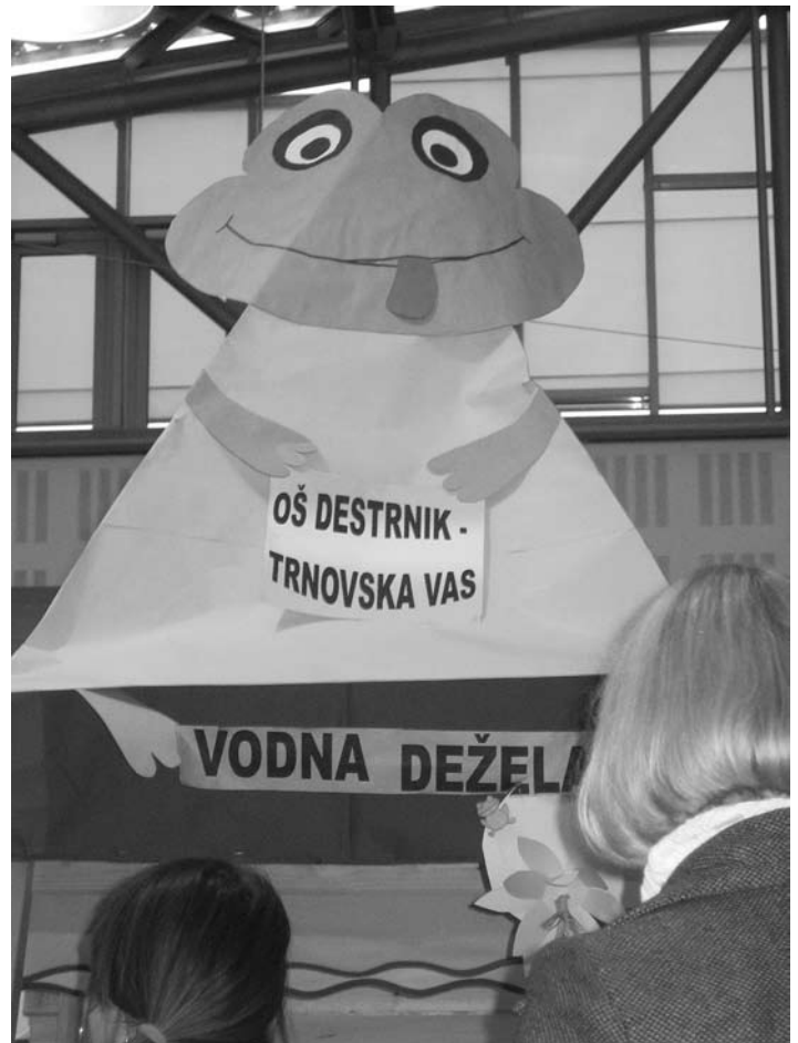
Maskota vodne dežele: Žaba Treza