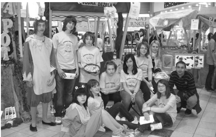
Najboljši v letu 2009 OŠ Destrnik-Trnovska vas.

Ob tem bi se radi zahvalili tudi vsem staršem, učiteljem, znancem in prijateljem, ki so si vzeli čas in nas prišli obiskat na Ptuj, ter tudi tako pripomogli k našemu velikemu uspehu.