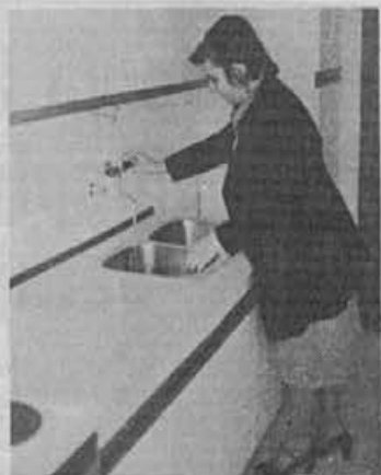
Ali voda teče?