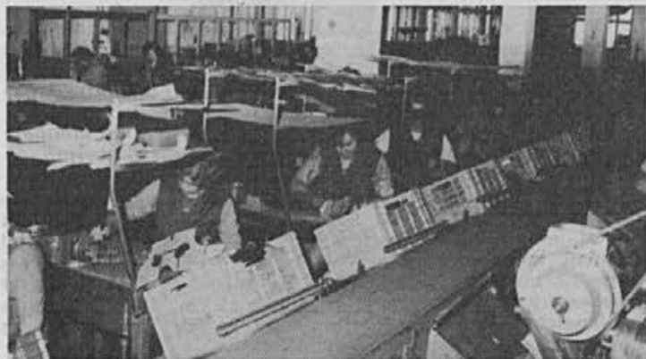
Kaj bo nova organizacija prinesla šivalnici