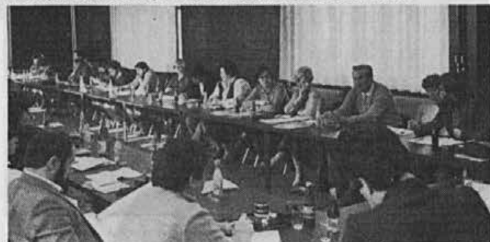
Organizatorji in novinarji v obveščanju v združenem delu so se zbrali v Alpini

V petek, 20. novembra so se v Alpini na prvem delovnem srečanju sestali člani aktiva novinarjev in organizatorjev obveščanja v združenem delu Goreniske.