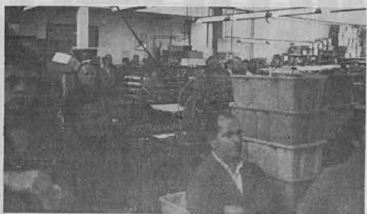
Hala res ni najbolj primerna za zbor delavcev