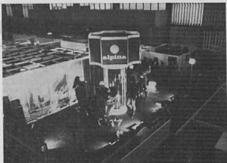
Program na razstaviščnem prostoru Alpine na sejmu Snežinka je privlačil