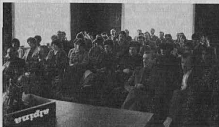
Servisirji in prodajalci na posvetu