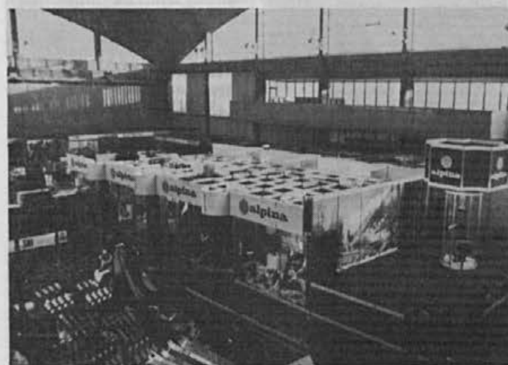
Okusno urejen razstaviščni prostor prav tako