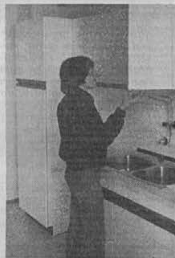
Kuhinja že v stanovanju