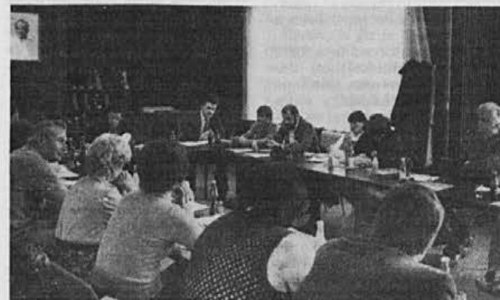
S posveta organizatorjev obveščanja