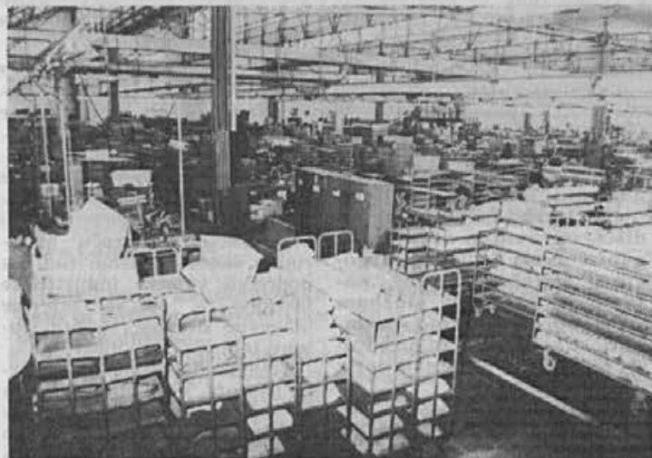
Delovne razmere v montaži so sicer boljše, toda še vedno so pomanjkljivosti