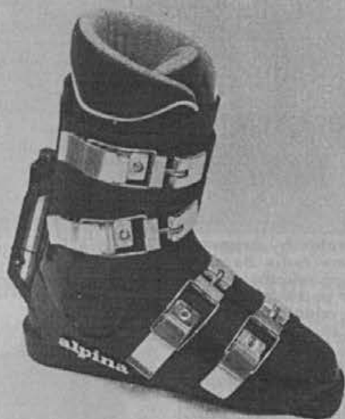
Najnovejši dosežek Alpine – tekmovalni čevlji SR 84