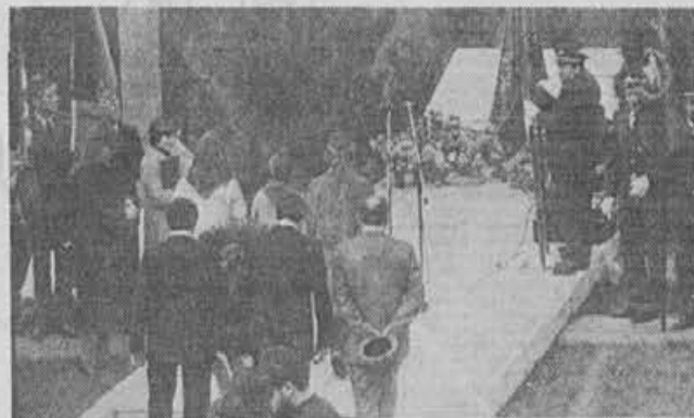
Komemoracija ob dnevu mrtvih – nastop pionirjev