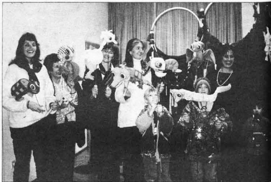
Po lutkovni predstavi v Mohorjevi šoli v Celovcu.