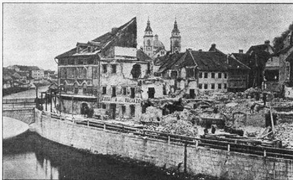
Podrta Ljubljana; pogled proti (sedanjemu) Tromostovju in stolnici.

Novi in zanimivi prizori so se pa začeli zvečer: nihče ni hotel spat pod streho v hiši, vse je leglo pod milim nebom. Vozniki so