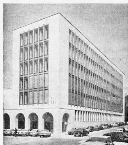
Novo poslopje tržaškega radia

Po 33 letih svojega obstoja in delovanja, po 20 letih delovanja slovenskega odseka ima končno tržaška radijska postaja svoj novi sedež v središču mesta.