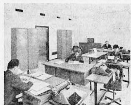
Pogled v studio tržaškega radia

Hodniki in prostori so preprosto, a zelo okusno opremljeni in okrašeni. V veži vidimo delo tržaškega kiparja Marcella Mascherinija, po sobah pa bodo razna dela pokrajinskih umetnikov.