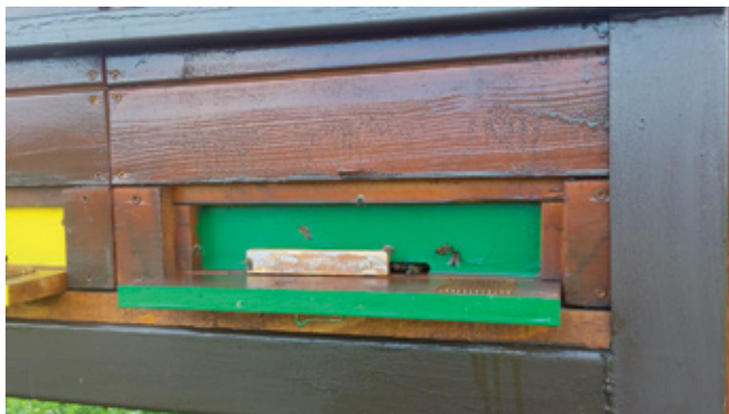
Zožena žrela panjev

nje. Najbolje jo je omesti iz panja, panj zapreti in satje shraniti. Tako družino lahko tudi združimo z drugo. Sam to naredim tako, da jo premestim v medišče normalne družine. Prav tako združim tudi vse slabiče, pri katerih ocenim, ali so čebele zdrave ali pa so številčno oslabele zaradi slabe matice, zaradi česar je negotova uspešna prezimitev. Panje, ki jih izpraznim, vedno takoj zaprem in vse satje shranim tako, da je za čebele nedostopno. Ta mesec je še mogoča menjava matic, če jih imamo na razpolago. Po navadi je sprejem matic septembra zelo uspešen. Sam jih sicer po večini menjam že prej, ta mesec pa le še pri tistih družinah, ki so bile na poznih pašah. Trudim se, da v svojem čebelarstvu nimam več kot dve leti starih matic. Žrela panjev lahko po potrebi zožimo zlasti med krmljenem, če tega nismo storili že prejšnji mesec. To je zlasti priporočljivo pri šibkejših družinah, saj s tem povečamo njihovo možnost uspešne obrambe panja pred mo-