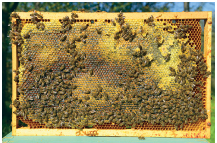
Sat z zimsko zalogo sladkorne raztopine

Pri družini, pri kateri smo med kontrolnim pregledom oz. ocenjevanjem zalog opazili, da nima matice ter da še ni izropana, je potrebno ukrepa-