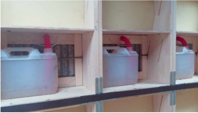
Dodajanje sladkorne raztopine za zimsko krmo